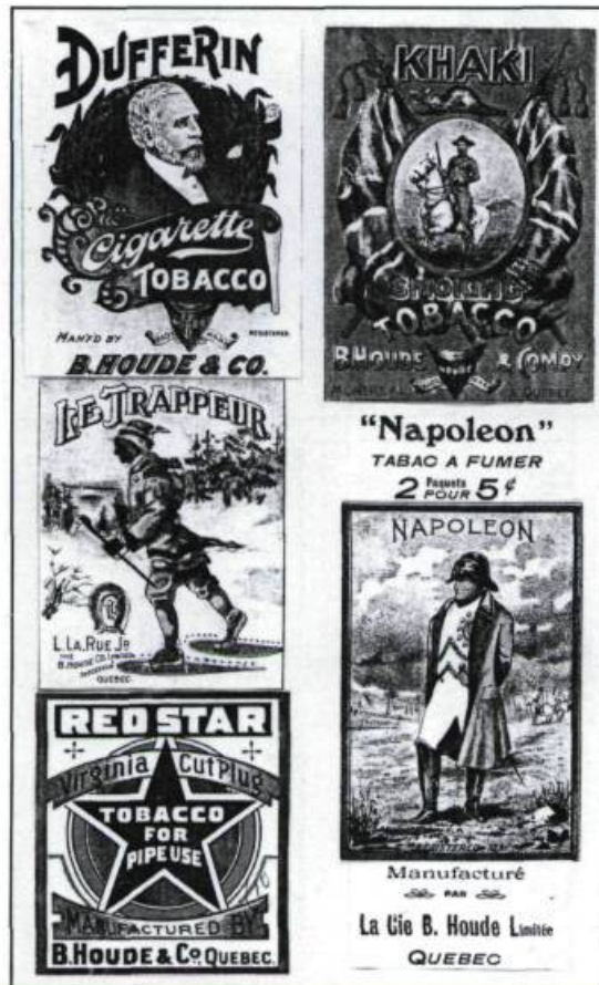
Quelques marques célèbres de la maison B. Houde au tournant du XXI ème siècle.

La maison B. Houde & Cie se lança dans la production de diverses variétés de tabacs à pipe. Elle commercialisa aussi des tabacs à priser qu'elle obtenait en réduisant en poudre les tiges centrales des feuilles de tabac foncé. Cette poudre était, par la suite, déposée dans des barriques en bois afin d'y fermenter durant plusieurs mois. Le tabac en poudre avait, comme le vin, la réputation de se bonifier en vieillissant.