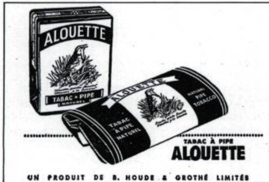
Le tabac Alouette, longtemps une marque fort appréciée des fumeurs de pipe. Publicité de la fin des années 1940.