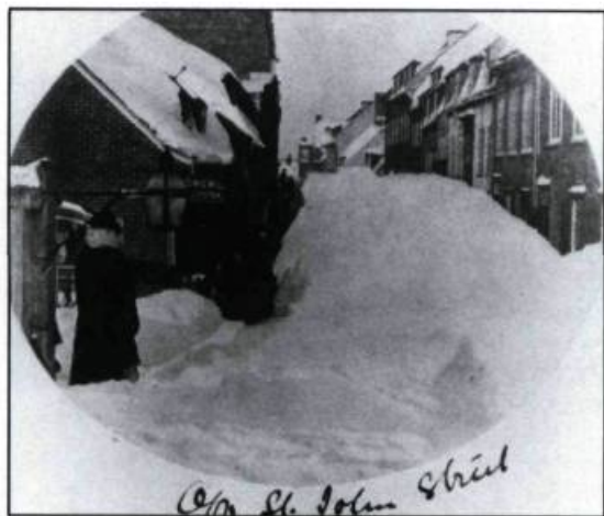
La rue Saint-Jean ensevelie sous la neige vers 1880.

«habitat convenable», à transformer la trame des rues suivant le principe qui a présidé à la création du faubourg; recréer des rues piétonnes, fermer des sections d'artères, aménager les pentes abruptes avec des escaliers, réintroduire un mobilier urbain conforme à notre climat, à nos matériaux (pas d'importations de Boston ou de Hollande), et ceci en tenant compte de nos traditions architecturales et esthétiques; les bancs de neige font partie de notre patrimoine; les cours doivent retrouver leurs arbres, leurs jardins;