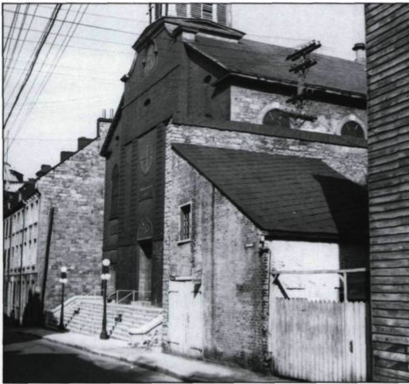
De 1833 à 1960, l'église St. Patrick située rue McMabon a été le véritable «bome» de la communauté irlandaise de Québec.

En 1815, «Anglais» et «Canadiens» avaient fait de Québec une inexpugnable forteresse qu'ils étaient prêts à défendre contre ces envahisseurs qui se disaient les compatriotes des Britanniques et les coreligionnaires des catholiques.