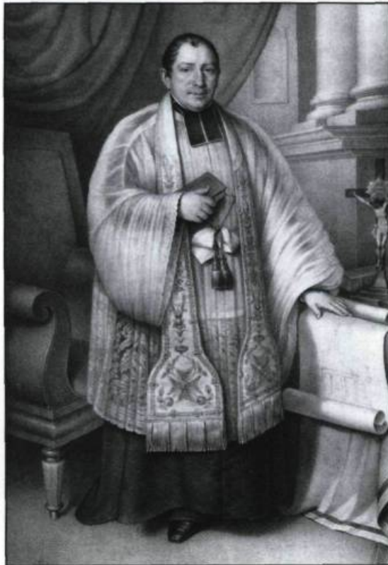
Portrait du père Patrick McMabon, un des premiers leaders à se consacrer à la défense des droits des Irlandais. Cette peinture est l'oeuvre de Théophile Hamel.

«Anglais» et «Canadiens» (surtout ceux de la Haute-ville) reprochaient à ces intrus d'être pau-