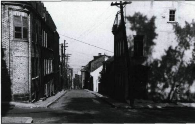
La rue Saint-Eustache avant sa disparition, aujourd'hui l'autoroute Dufferin-Montmorency. (Archives de la ville de Québec).

taire desserre son emprise et les terrains jadis réservés à la défense s'ouvrent dès lors à l'expansion urbaine.