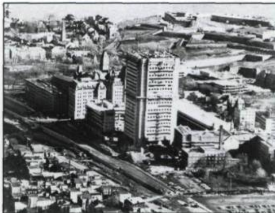
Construction de l'édifice «G»: vue aérienne.

Un an après son accession au pouvoir, le gouvernement Lesage ressuscite la Commission d'embellissement de Québec créée en 1941, mais invalidée par Duplessis depuis 1944. Réorganisée