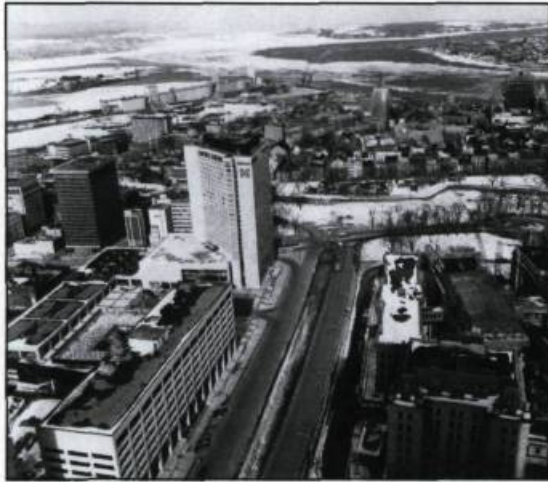
Le boulevard Saint-Cyrille: vue vers l'est avec les nouveaux immeubles qui le longent.

garantir une « compositon harmonisée du jeu des masses » pour respecter la prédominance de l'institution parlementaire. En accord avec le Rapport Fiset, la ville adopte en avril 1964 un règlement (no. 1377) pour limiter la hauteur des édifices dans le secteur avoisinant la Cité parlementaire. La même année, un groupe d'hommes d'affaires de Montréal cherche à obtenir un permis de construction d'un hôtel et d'un immeuble à bureaux dont la hauteur excède la hauteur permise. Il s'agit de la Trizec Corporation avec son projet de Place Saint-Cyrille qui deviendra Place-Québec. Le promoteur menace de retirer son projet si les normes de construction restent limitatives quant à la hauteur et donc à la rentabilité de l'investissement.