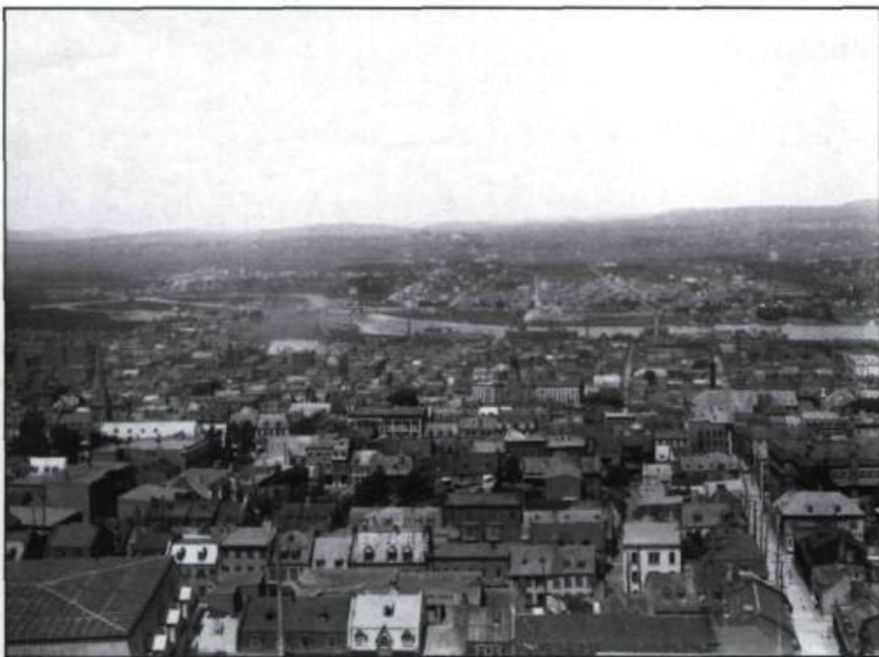
Vue du faubourg Saint-Louis avant la construction de l'édifice «G».

La reconstruction du faubourg Saint-Louis amène le gouvernement de la province à installer le nouvel Hôtel du Parlement sur l'ancien champ de cricket de la garnison, à l'est de la rue Saint-Augustin. La mise en chantier de cet édifice de prestige à cet endroit aura pour effet de stimuler la construction domiciliaire en haussant la valeur des terrains des propriétaires incendiés. De fait, la présence du Parlement, achevé en 1886, amène la transformation de la Grande-Allée en un large boulevard aristocratique bordé de maisons cosues. À l'ouest du faubourg, une nouvelle artère, le boulevard Saint-Cyrille, permet de rejoindre l'avenue de Salaberry à partir de 1898. Ces transformations annoncent une nouvelle vocation pour le faubourg. La population ouvrière cède graduellement la place aux commis et employés de bureaux rattachés à l'administration provinciale.