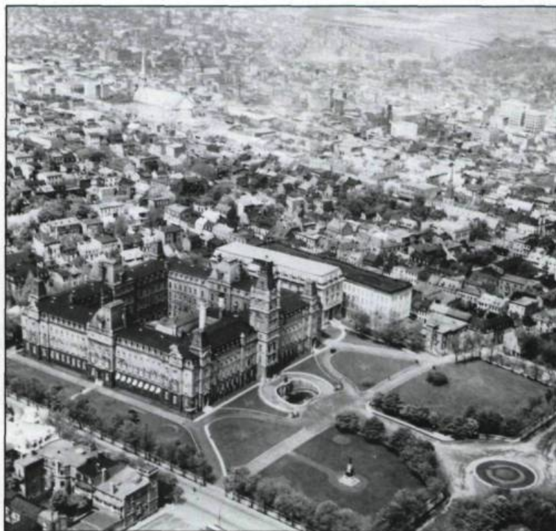
Vue aérienne montrant le paysage urbain entourant l'Hôtel du Parlement avant l'édification du Complexe «H» et de Place Québec.

Le principe général qui guide la conception du plan repose sur l'idée d'accorder à la Cité parlementaire la prééminence dans le paysage urbain de la Capitale, à savoir qu'aucun édifice ne devait dépasser en hauteur la tour du Parlement. Le rapport Fiset définit donc les normes devant régir la construction sur toute la Colline parlementaire, particulièrement la hauteur des édifices qui ne devaient pas dépasser une certaine limite pour