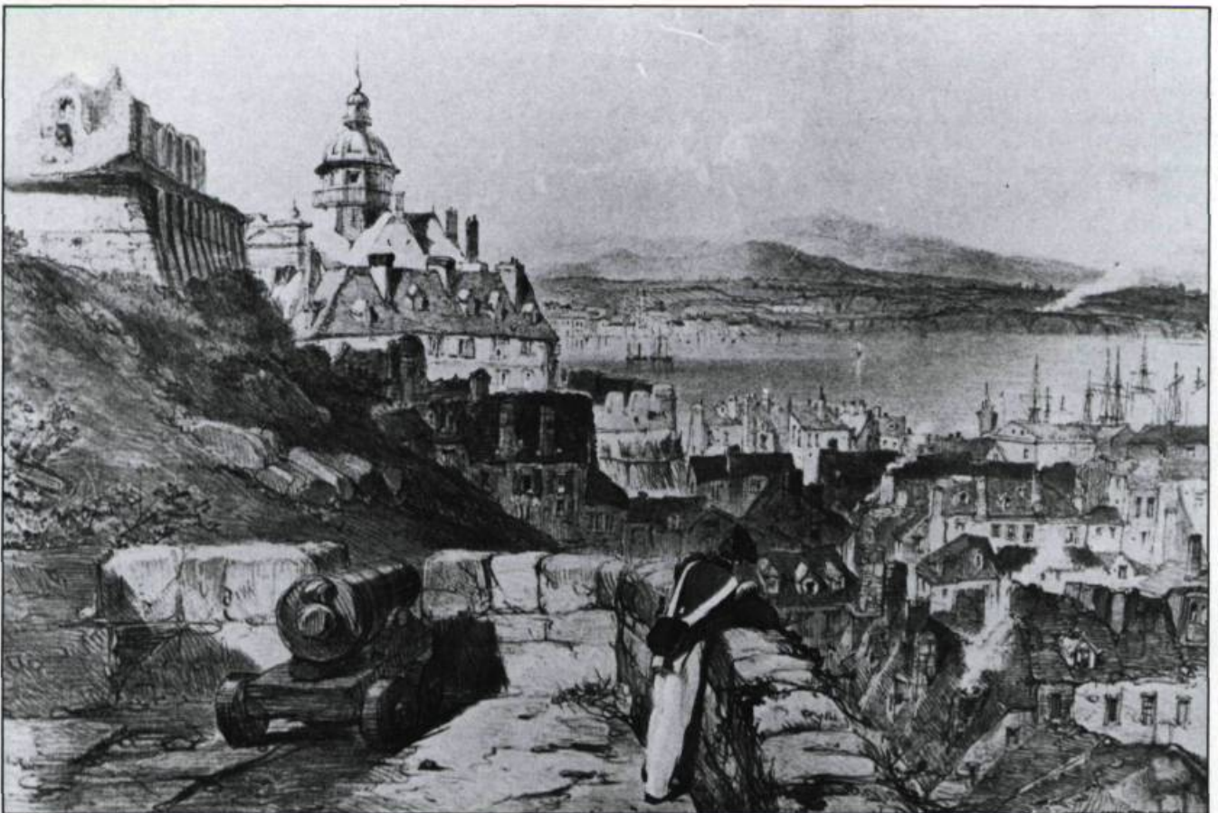
Prise du promontoire, cette vue de Québec avec sa Citadelle dominant la basse-ville et le fleuve, son château Saint-Louis en ruines illustre bien l'aspect moyenâgeux signalé par Henry Thoreau. Gravure d'après un dessin de Coke Smyth pour Sketches with Canadas , 1840. (Coll. privée).

Un demi-siècle plus tard, en 1893, la comtesse d'Aberdeen, en reportage photographique au Canada, n'ose décrire la situation. Elle conseille à ses lecteurs de regarder les illustrations de son livre pour constater la beauté des lieux. Et elle aime bien le peuple québécois. Il s'agit pour elle d'un peuple « frugal, satisfait, respectueux des lois et religieux »; toujours de simples paysans normands et bre-