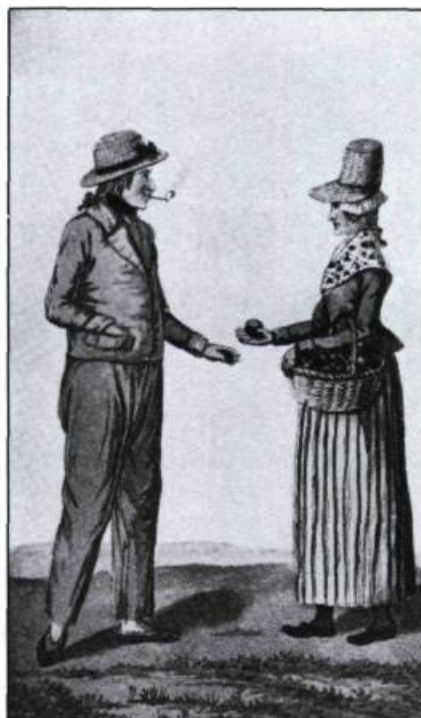
Habitants en costume d'été. Tiré de: John Lambert, Travels Through Canada, 1816.

Haute-ville et basse-ville: la distinction remonte aux origines de Québec. Tous les voyageurs ont noté les deux niveaux d'habitation, le passage unique par la Côte de la Montagne, le site «imprenable» du Cap-aux-Diamants. Les voyageurs s'épargnent souvent des mots en référant les lecteurs à leurs prédécesseurs. Les Anglais, nous dit le Duc Bernhard de Saxe-Weimar en 1825, comparent facilement Québec à Gibraltar. Charles