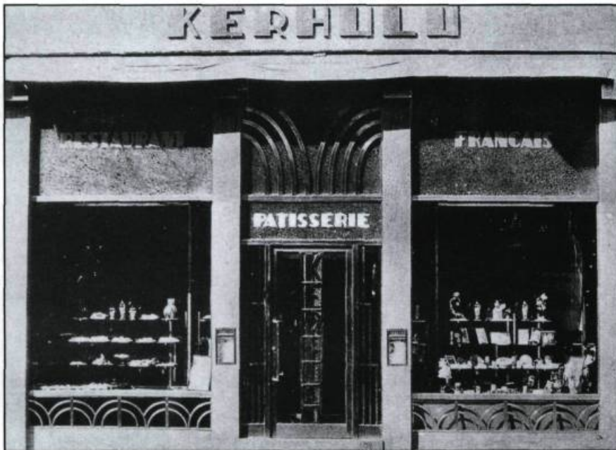
Maurice Genevoix, de passage à Québec en 1939, écrit que le restaurant Kerbulu était à son époque le meilleur établissement du genre au Canada. Carte postale.