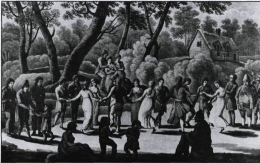
Plusieurs visiteurs de Québec ont signalé et remarqué la gaieté des Canadiens français. Aquarelle de J.C. Stadler, d'après un dessin de George Heriot in Travels Through the Canadas , 1807.

du fleuve devient intolérable. La haute-ville, par contre, héberge « les gens distingués », comme le dit Kalm. Après la Conquête, marchands et militaires anglais s'installent en grand nombre. Mais rien n'empêche que la ville paraît « étrange pour le