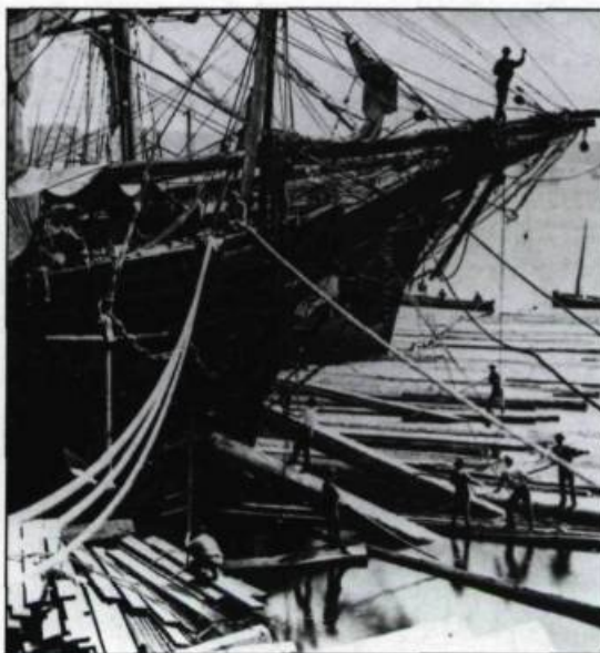
Une fois mesuré, le bois était chargé à bord des grands voiliers en direction de l'Angleterre. Québec, 1872.

À la fin du XIX ème siècle, les membres de la vieille bourgeoisie anglophone conservent tout de même des intérêts économiques importants