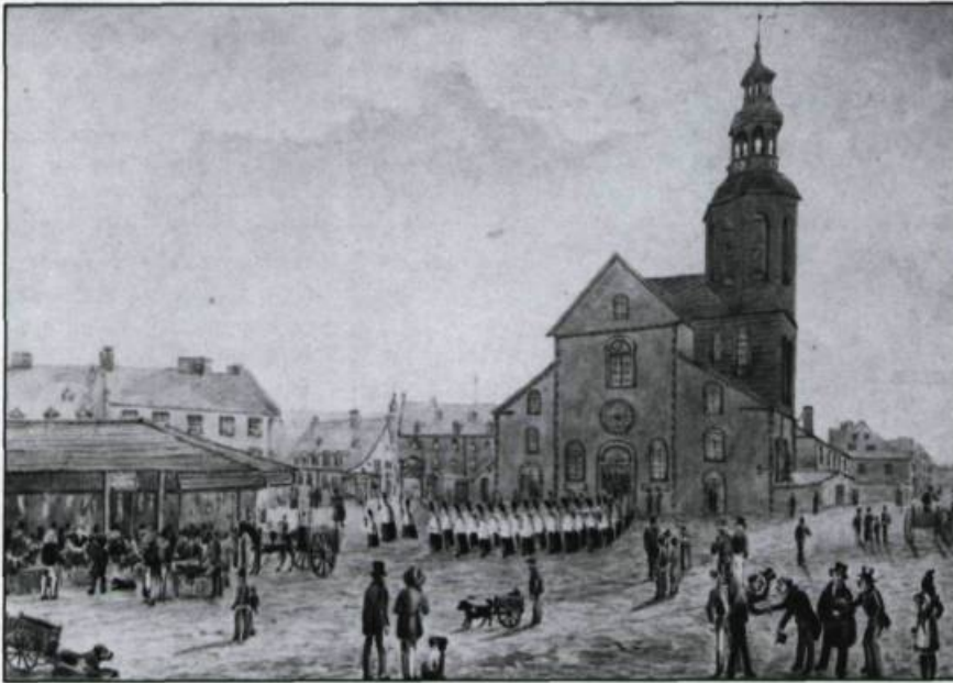
Certains peintres-topographes ont privilégié des vues plus intimistes, tout en décrivant avec exactitude les édifices importants de la ville. James Pattison Cockburn, La procession de la Fête-Dieu à Notre-Dame de Québec en 1830 . (Photo: Musée du Québec).

de reproduire rapidement et avec peu de matériel des relevés architecturaux et topographiques précis et détaillés. Cette technique, au départ considérée uniquement comme un moyen de réaliser des esquisses ou des croquis préparatoires, fut bientôt reconnue en Europe comme un art en soi.