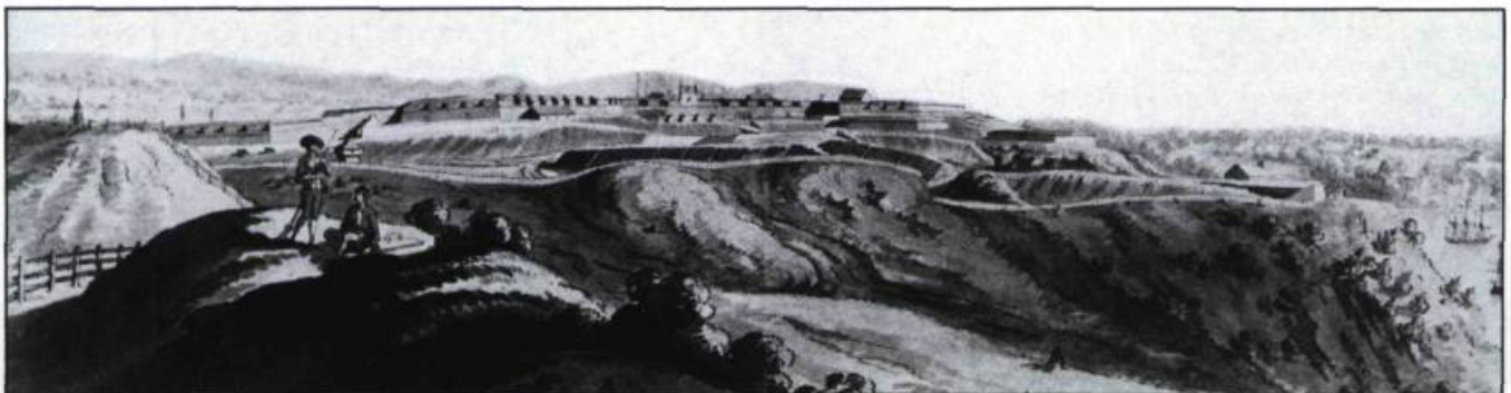
James Peachy, vue de Québec , 1794.