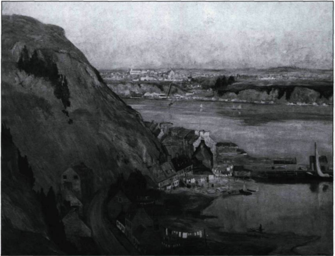
Au cours de la seconde moitié du XIX ème siècle, les sites favoris des artistes changent. Ils privilégient des endroits moins touristiques et la recherche picturale empiète sur la valeur patrimoniale et historique du sujet. Maurice Cullen, l'Anse des mères , 1904.