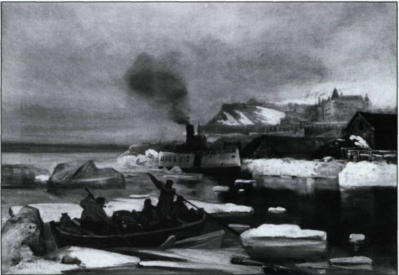
Ce site, déjà fort exploité depuis le XVIIIème siècle, démontre les changements stylistiques de la production typiquement canadienne. On y sent l'influence du mouvement académiste français. Charles Huot, Québec vue du bassin Louise, s.d..

En littérature à la même époque, les récits de voyages du Nouveau