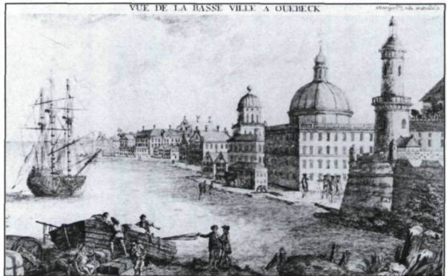
Cette représentation de Québec n'a de réel que le titre. Elle démontre à quel point cette imagerie fut tributaire de l'imagination ou encore de l'absence d'informations précises des artistes, qui illustraient parfois la ville sans jamais y avoir mis les pieds. François-Xavier Habermann, Vue de la basse-ville à Québec, vers le fleuve Saint-Laurent . (Coll. privée).

À partir de la Conquête en 1759, l'arrivée de topographes de l'armée britannique modifiera quelque peu le mode de représentation et influencera l'évolution de l'imagerie. À l'académie militaire de Woolwich en Angleterre, les officiers de l'artillerie ou du génie reçoivent une formation poussée en dessin et en art du paysage. Les professeurs y enseignent, à des fins strictement militaires, la technique de l'aquarelle qui permet