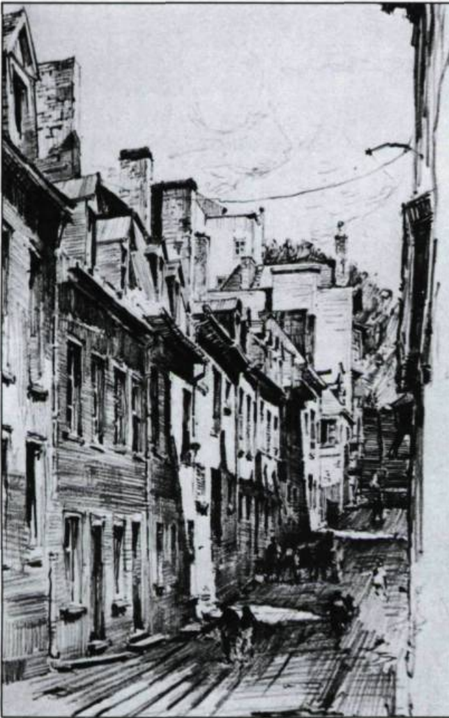
Ce fusain d'Herbert Raine nous rappelle les dessins de Victor Hugo dans la seconde moitié du XIX ème siècle. Le foisonnement de lignes réalisées d'une main sûre et rapide, par Herbert Raine, contribue à mettre l'embase sur l'aspect délabré de ce secteur déjà surpeuplé. Herbert Raine, Little Champlain Street, Québec . (Photo: N. Bazin, Musée du Québec).