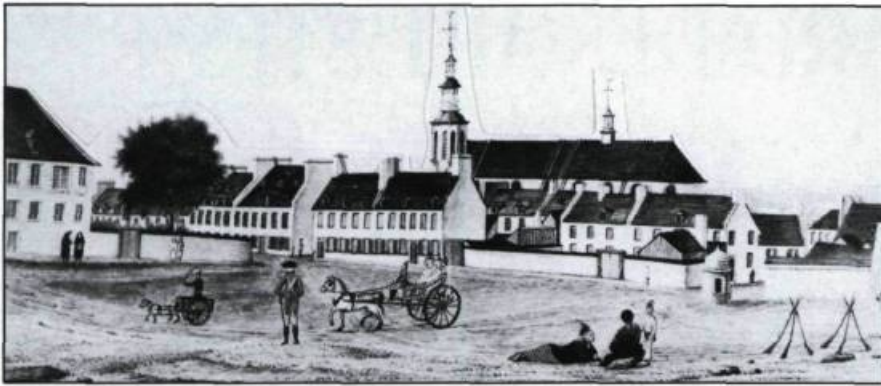
Peintre-topographe de l'armée britannique, Thomas Davies détaille ici les édifices avoisinant le terrain d'exercices militaires. Le style épuré et précis illustre le caractère descriptif utilisé par ces artistes-officiers. Thomas Davies, La Place d'Armes à Québec , 1789. (Musée des Beaux-Arts du Canada, Ottawa).