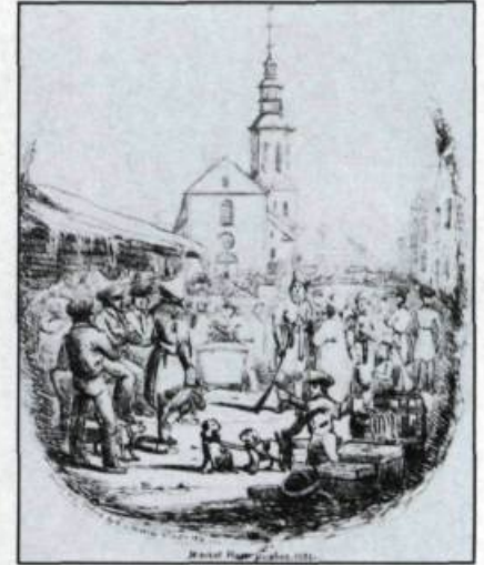
T.G. Marlay, «Market Place», Québec, 1831 . Eau forte tirée de Mary Allodi, Les débuts de l'estampe imprimée au Canada (Royal Ontario Museum, 1980).

(Gravure de N.P. Willis, Canadian Scenery Illustrated , Londres, 1842).