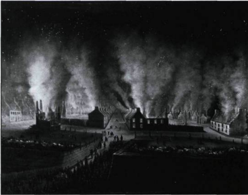
De conception romantique, mais plus respectueuses des réalités locales, les oeuvres de Joseph Légaré, moins stéréotypées que celles des peintres anglais, ouvrent la voie à une nouvelle approche du paysage canadien. Joseph Légaré. L'incendie du faubourg Saint-Jean, le 28 juin 1845.

resque, qui devait connaître une grande popularité auprès des amateurs. Empreint de romantisme, le vocabulaire formel de ce mouvement exploitait le côté sensationnaliste des sites. Les artistes usaient volontiers de ciels mouvementés, du fleuve déchaîné, d'édifices en ruines ou noyés dans la brume pour présenter Québec d'une manière théâtrale, saisissante et imposante. À l'aide de ces moyens picturaux, ils dramatisaient la scène et la rendaient évocatrice.