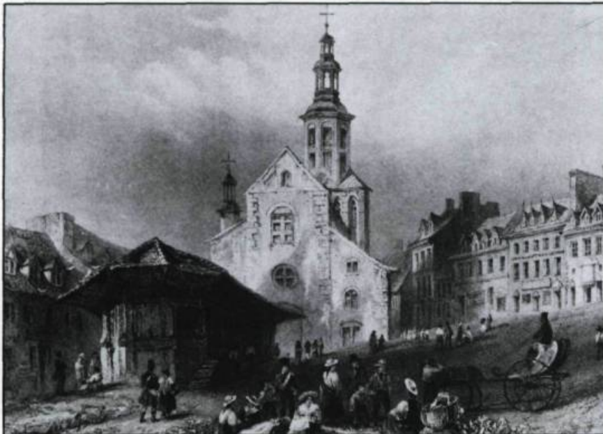
Dans cette autre illustration de la place du marché vers 1830, William Bartlett y confirme son appartenance au mouvement pittoresque. Le traitement des personnages et de l'environnement met en valeur le site en lui donnant un caractère romantique. William Bartlett, «The Market Place» .

Les peintres-topographes qui introduisent cet art au Canada stimulent, par leur habileté et l'abondance de leur production, l'engouement des dilettantes pour l'aquarelle. Parmi ces peintres-topographes de talent, tous hardis voyageurs, quelques aquarellistes féconds nous ont légué des vues de Québec et de ses monu-