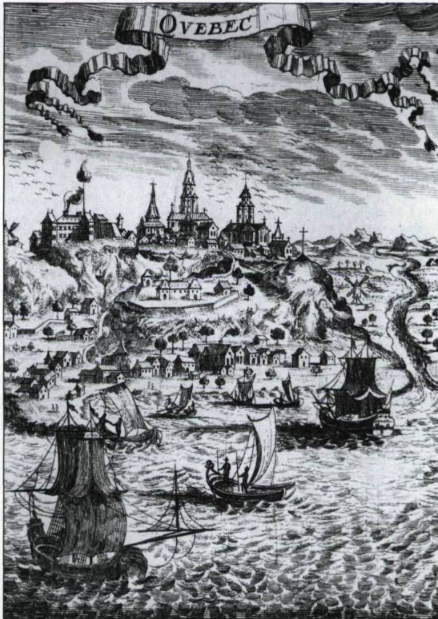
Cette gravure publiée en 1683 à Paris montre comment certains artistes manipulent la perspective afin de simplifier la vue. (Coll. Yves Beauregard).

Nous vous proposons donc de redécouvrir ici la vieille capitale par les yeux des artistes qui l'ont visité ou qui y ont séjourné. Oublions pour quelques instants le Québec des cartes postales récentes et faisons, à l'aide de ces artistes, le périple d'hier à aujourd'hui pour découvrir cette cité que Xavier Marmier décrivait en 1860 dans un style coloré: «ville de guerre et de commerce perchée sur un roc comme un nid d'aigle et sillonnant l'océan avec ses navires, ville du continent américain, peuplée par une colonie française, régie par le gouvernement anglais, gardée par des régiments d'Écosse, ville du moyen-âge par quelques-unes de nos anciennes institutions et soumise aux modernes combinaisons du système représentatif, ville d'Europe par sa civilisation, ses habitudes de luxe et touchant aux derniers restes des populations sauvages et aux montagnes désertes, ville située à peu près à la même latitude que Paris, et réunissant le climat ardent des contrées méridionales aux rigueurs d'un hiver hyper-