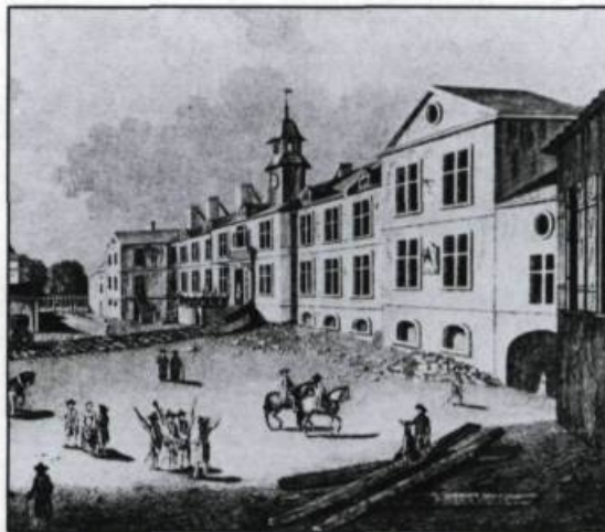
Le Palais de l'Intendant où se tiennent toutes les délibérations sur les affaires de la Province. Gravure de Richard Short, vers 1761. (Archives publiques du Canada).

Jusqu'au milieu du XIX ème siècle, la ville est demeurée un espace de transition et d'adaptation au pays. Malgré la multiplicité des richesses et des possibilités du nouveau continent, deux voies, deux destins s'offraient plus particulièrement. Ils ont donné naissance à deux types culturels plus ou moins mythiques: l'agriculteur et le coureur des bois. Le premier, voulu et recherché par les autorités civiles et religieuses, représentait la sédentarité, la stabilité et la moralité. Le défricheur, fixé sur sa terre nourricière, élevait une nombreuse famille dans le respect de Dieu, du roi et de leurs nombreux mandataires. Le second a davantage été identifié au chevalier des grands espaces, parcourant inlassablement un territoire