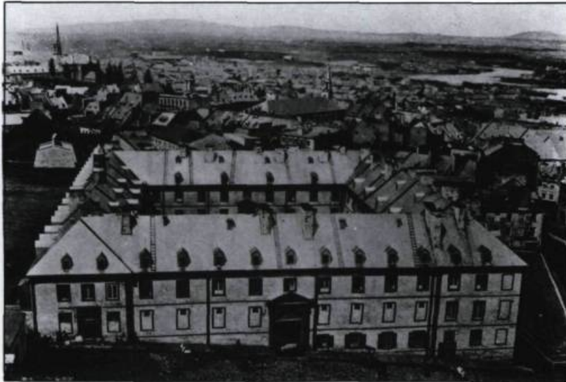
Le Collège des Jésuites fut fondé en 1635. Démoli en 1878, il occupait le site de l'Hôtel de Ville actuel. J.-E. Livernois, s.d. (Archives de la ville de Québec).

les traditions culturelles d'origine ne pouvaient être que profondément transformées.