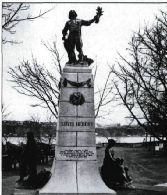
Monument de Louis Hébert entouré de son épouse Marie Rollet et de son gendre Guillaume Couillard, vraisemblablement le premier noyau familial qui vécut de l'agriculture à Québec.

Les changements n'ont pas été moins significatifs dans le monde rural, qui regroupait de 75 à 80 pour cent de la population. Les terres étaient disponibles, extraordinairement abondantes même, par comparaison avec la situation qui prévalait dans la mère-patrie. Encore fallait-il les gagner sur la forêt, trimer toute une vie pour défricher de quoi faire vivre une famille. Et à chaque génération, il fallait recommencer. Quelle qu'ait été la voie choisie, course des bois ou agriculture,