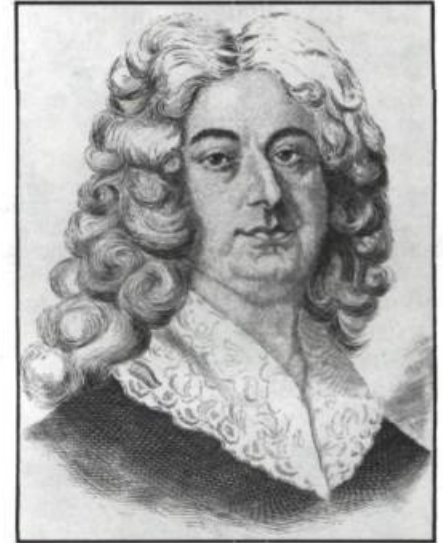
Gravure de Gilles Hocquart, intendant de la Nouvelle-France de 1729 à 1748. Tirée de l'Histoire des Canadiens français par Benjamin Sulte, tome V, Montréal, 1882.

lon qui se trouve au sud-est. Un petit bureau est aménagé à côté de chacun des dépôts. Le tout est voûté et pavé de carreaux de pierre et de brique. Seules les armoires, portes et fenêtres ont été fabriquées en bois. Les coûts atteignent 2738#. À la fin de l'automne 1733, une fois les vaisseaux partis, Hocquart fait déposer dans les voûtes du Palais les archives du Conseil supérieur et de la Prévôté de Québec ainsi que les greffes des notaires décédés.