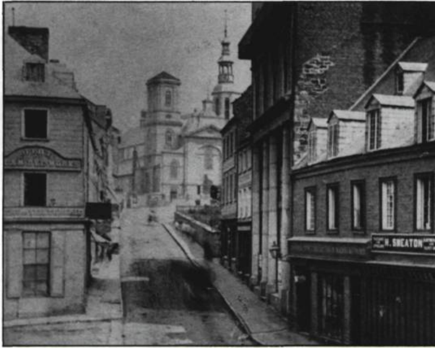
Démoli en 1898, lors des travaux d'élargissement de la Côte de la Fabrique, l'immeuble où logeait l'Institut canadien est l'oeuvre de Joseph Ferdinand Peachy. L'hôtel de ville, le palais Montcalm, l'église méthodiste wesléyenne et la bibliothèque Gabrielle-Roy accueilleront tour à tour la bibliothèque.