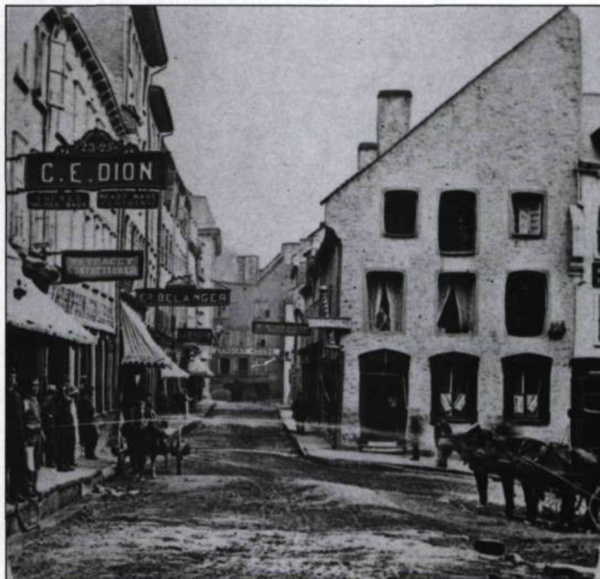
Photographie de la rue Notre-Dame en basse-ville vers 1865. Demi-stéréogramme. (Archives du Séminaire de Québec).

On établit généralement à une quarantaine le nombre de rues tracées et