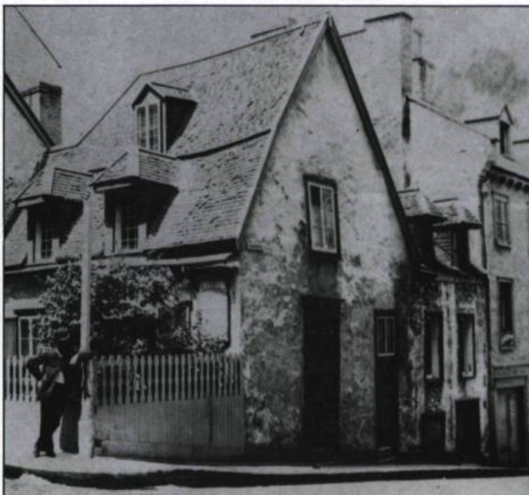
La maison Jacquet, sise rue Saint-Louis. (Ministère des Affaires culturelles).

C'est cette ville classique, déjà connue et fréquentée en raison de ses monuments, que l'ère industrielle va considérablement modifier. Mais alors que partout dans la province, et surtout à Montréal, c'est l'architecture dite «victorienne» qui