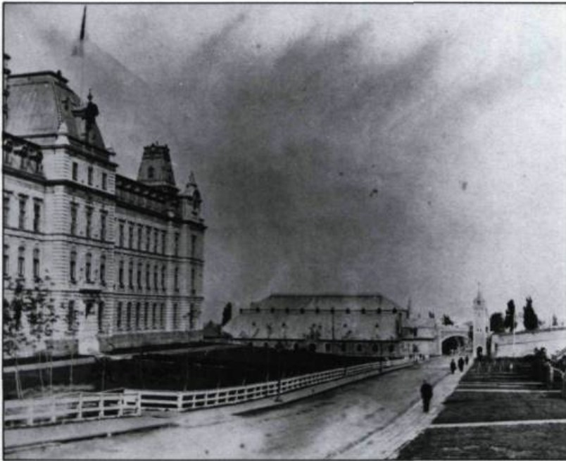
Cette représentation de l'aile sud du Parlement vers 1888 nous dévoile l'influence du style Second Empire. Son ornementation est toutefois plus dépouillée et plus réaliste. Ce pavillon latéral de l'édifice gouvernemental reprend les grandes lignes de la nouvelle aile du Louvre conçue au milieu des années 1850. (Inventaire des biens culturels, Québec).

les écrits des années 1860-1920, qui révèlent une ville plutôt anglaise. En fait, depuis les années 1920 et surtout depuis 1960, Québec a été entièrement «refrancisée» pour être en mesure, en tant que capitale, de projeter une image conforme aux idéaux d'originalité et de souveraineté culturelles. Québec n'a donc pas été continuellement une ville française. Elle l'est redevenue par suite d'une concertation entre les autorités municipales et provinciales. Cette concertation n'est d'ailleurs rien d'autre que l'inscription, dans le paysage urbain, d'une campagne de refrencisation fondée sur un nationalisme politique et économique dont la Loi 101, adoptée en 1976 et décrivant le Québec français, n'est qu'un aboutissement logique.