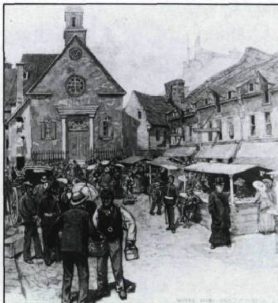
Scène de marché à la Place royale au début du XIXième siècle. Gravure, s.d..

Le XXIème siècle voit s'accroître substantiellement la contribution de la France à l'architecture du Québec. D'abord du fait de l'influence de l'École des Beaux-Arts de Paris, qui accueille les architectes du Québec. Ensuite par la venue au Québec d'architectes français. Un de ceux-là, Maxime Roisin, donne à la ville plusieurs édifices importants; il dresse aussi les plans de monuments commémoratifs qui retracent les grands moments de l'histoire de la Nouvelle-France et dont les personnages de bronze proviennent d'ailleurs d'ateliers parisiens.