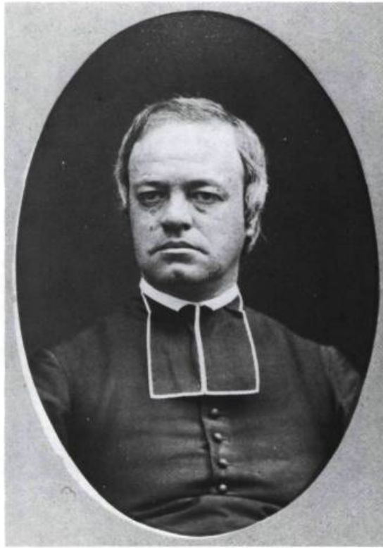
Monseigneur Thomas-Étienne Hamel, professeur de 1853 à 1875. Photographie de Jules-Ernest Livernois. Musée du Séminaire de Québec. Pierre Soulard, photographe.

avec une collection évaluée à 2 500 livres en 1843. Le prestige de l'institution et de la science augmente également à la suite des expériences, souvent impressionnantes, réalisées en public; véritables spectacles auxquels assiste l'élite culturelle et cléricale de l'époque.