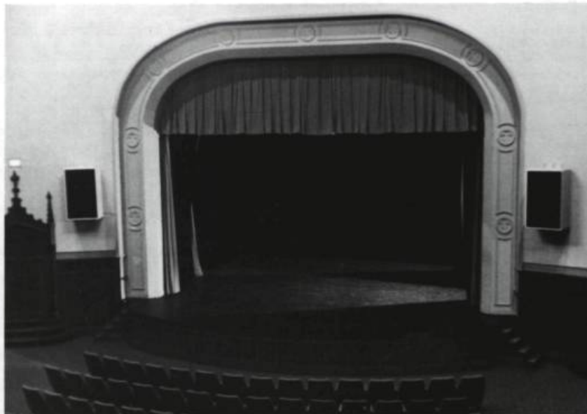
La scène dans son état actuel.