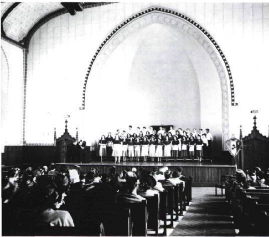
La nouvelle salle de concert et de conférence de l'Institut Canadien telle qu'on la voit en 1948.