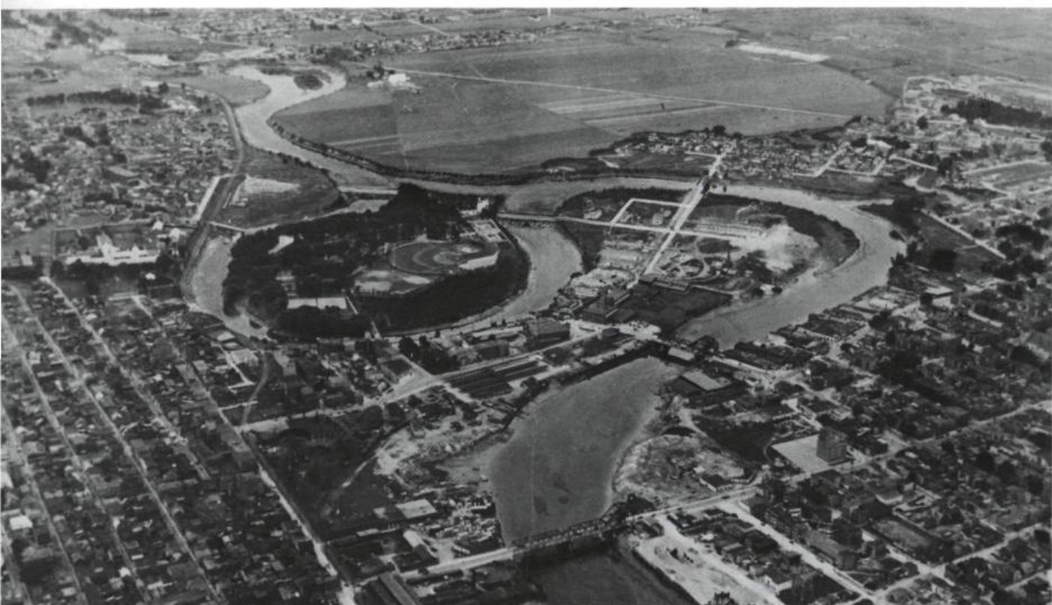
Après l'adoption du règlement de 1913, les activités de prostitution se déplacent vers la périphérie de la ville à Québec-Ouest et Petite-Rivière, sur la rive nord de la rivière Saint-Charles. Vue aérienne de Québec. 1949. Archives de la ville de Québec.

incendies doit éclaircir les circonstances de l'incendie d'une maison de prostitution sur le chemin de la Petite-Rivière. La compagnie d'assurance refuse d'indemniser le propriétaire, soupçonnant un incendie criminel, allumé par la population.