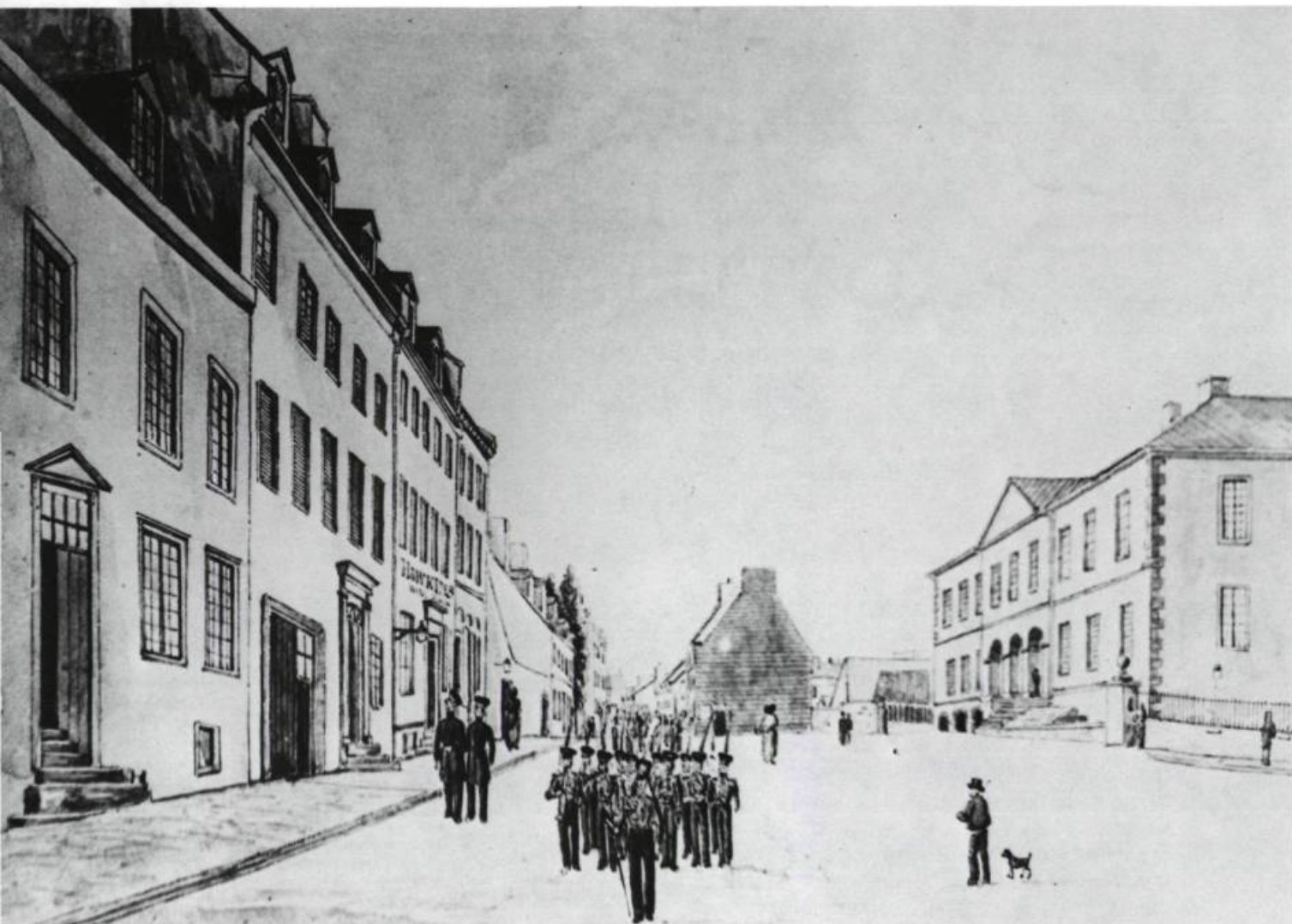
La présence militaire à Québec au XIX e siècle entraîne le développement d'activités de prostitution dans le faubourg Saint-Jean. J.P. Cockburn, 1830.

Les maisons de prostitution ne seront pas tolérées près, ou dans les rues avoisinantes d'une église ou d'une école. Elles devront être «garnies de jalousie en bois et fixes, afin qu'on ne puisse voir de l'extérieur, l'intérieur de la maison». Aucune sollicitation n'est permise à l'extérieur de la maison. Tout contrevenant à ce règlement encourt une amende de cent dollars ou six mois de travaux forcés et d'emprisonnement.