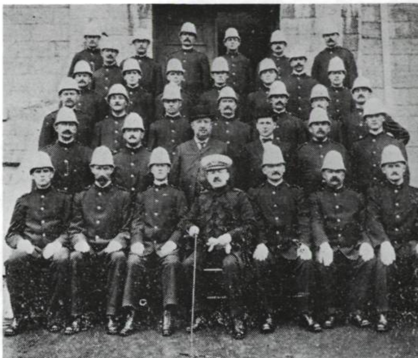
Les policiers municipaux ne peuvent réussir à enrayer la prostitution dans la ville. Policiers municipaux au début du XX e siècle.

Québec-ouest, contrôlées par les compagnies de spéculation, sont conscientes du problème des maisons de prostitution. Elles doivent améliorer l'image de la ville pour réussir à vendre leurs terrains avec un certain profit.