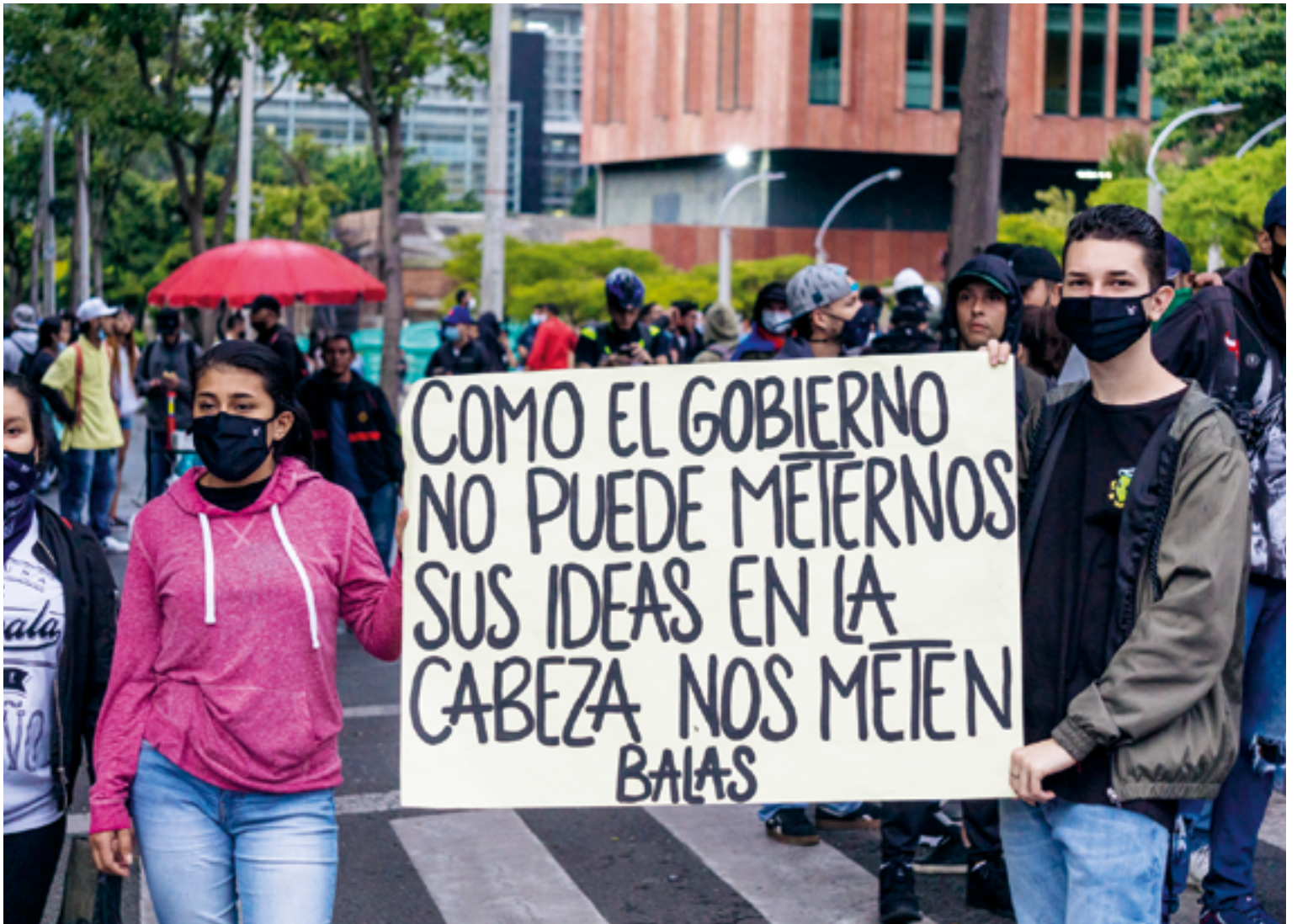
« À défaut d'arriver à nous mettre ses idées dans la tête, le gouvernement nous met des balles ».

Les manifestations qui ont débuté le 28 avril 2021 ont transformé le paysage politique de la Colombie. Ce qui était au départ une grève d'une journée s'est transformé en la mobilisation sociale la plus importante de l'histoire du pays.