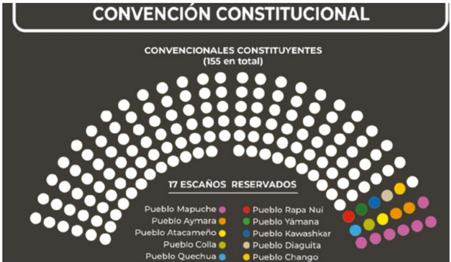
Carte des sièges à l'Assemblée constituante.

Un nombre croissant d'organisations de tous les peuples autochtones du pays, y compris des organisations mapuches, font la promotion d'une réforme constitutionnelle dans le but d'obtenir des sièges réservés à leurs peuples et de rendre possible leur participation à l'assemblée constituante qui sera élue en avril 2021. Cela signifie que les parlementaires de divers partis doivent présenter à la Chambre des députés un projet de réforme constitutionnelle prévoyant des sièges réservés aux représentant-e-s des Premières Nations au sein de la constituante.