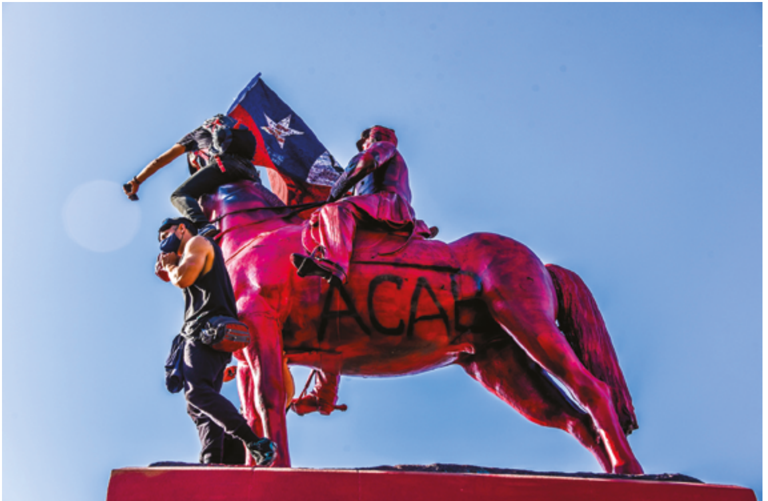
Manifestation à Santiago dans le cadre du référendum constitutionnel, octobre 2020.

Les restrictions imposées à l'exercice de ces droits dans un contexte de prolifération de projets miniers, forestiers, hydroélectriques ou d'élevage de saumons en territoires autochtones ont provoqué de nombreux conflits sociaux et environnementaux 2 . Les protestations autochtones ont été durement réprimées et ont entraîné de nombreuses poursuites judiciaires, ce que des organismes internationaux de droits humains ont condamné. À cela s'ajoute l'exclusion politique: en dépit de leur poids démographique, la représentation des peuples autochtones au Congrès national n'est que de 2,5 %. Finalement, l'exclusion économique des Autochtones s'observe dans les indices élevés de pauvreté: sept des dix communes les plus pauvres du Chili se trouvent en Araucanie, où vit la majorité des Mapuches.