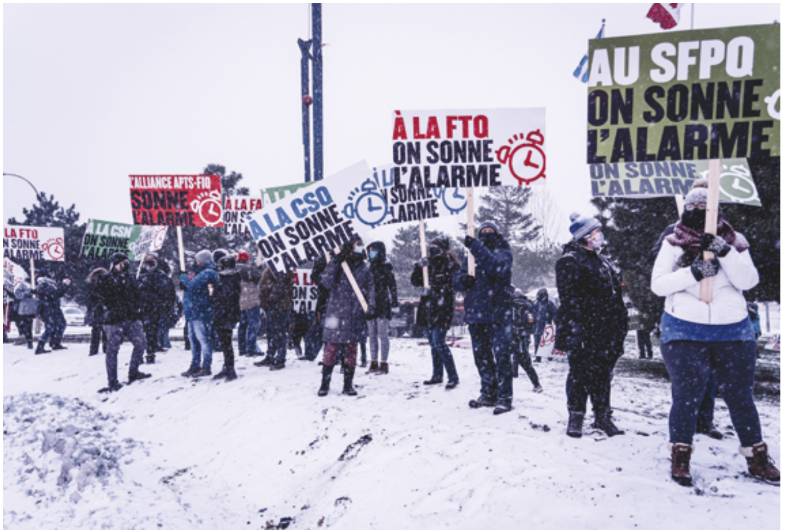
Des travailleurs et des travailleuses de différentes organisations syndicales ont participé en décembre 2020 à une action de visibilité, au pied du pont Jacques-Cartier à Montréal, pour sonner l'alarme à propos de la négociation du secteur public. Ils et elles réclament des offres concrètes pour résorber la crise qui sévit dans leurs milieux de travail depuis bien avant la pandémie.

vers le lieu de travail où se tiendraient les lignes de piquetage, comment respecter ce principe de solidarité intersyndicale en temps de grève? Voilà pour le moment une énigme qui nous fait d'autant plus regretter l'absence de front commun dans les négociations actuelles et qui, souhaitons-le, pourrait malgré tout être compensée par une coordination accrue des mandats de grève entre les différentes organisations.