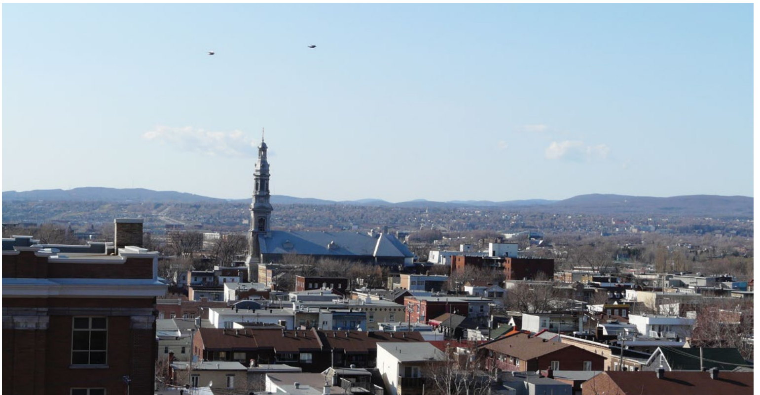
Quartier Saint-Sauveur, ville de Québec.

Dans Saint-Sauveur, Limoilou, Saint-Roch et Saint-Jean-Baptiste, quatre quartiers centraux populaires en gentrification, se loger coûte de plus en plus cher. Les loyers demandés pour les logements annoncés à louer depuis le début de l'hiver 2020 2 excluent d'emblée une bonne partie des ménages des classes populaires.