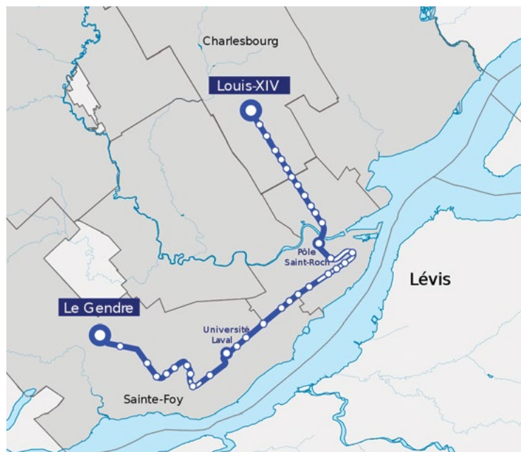
Carte: Jean Dubé.

L'idée derrière le développement du tramway n'est pas d'uniformiser les préférences (et les comportements) et de pénaliser les automobilistes, mais plutôt d'améliorer les milieux de vie en corrigeant, en partie, un déséquilibre qui existe actuellement