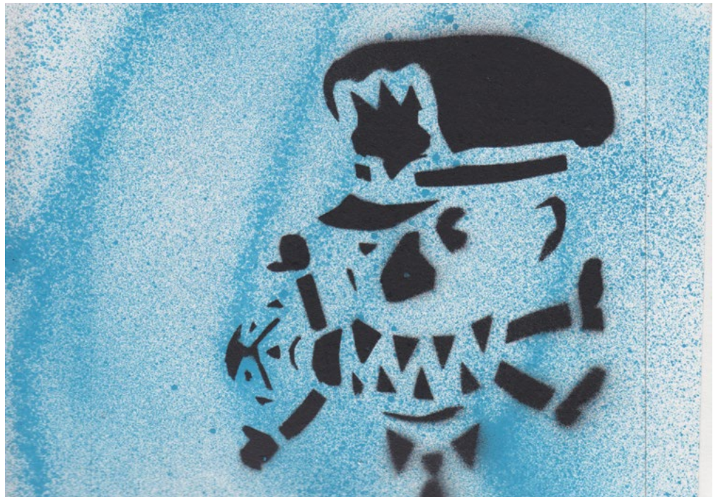
Boeuf. Pochoir: Ramon Vitesse.

Les forces policières font leur part pour déstabiliser les efforts des parents des jeunes noir·e·s et autochtones, et ce, dès un jeune âge. La police envoie un message clair à ces jeunes en les suivant dans la rue, en les tabassant, en leur demandant constamment leurs papiers, en rôdant dans leurs quartiers, en harcelant leur famille, sans égard pour leur dignité ni leur vie privée, sous prétexte de chercher un suspect ou d'assurer la sécurité. Le message passé à tou·te·s les Autochtones et Noir·e·s est que notre présence même dans l'espace public et dans la société pose problème.