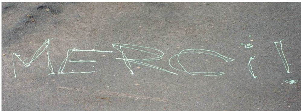
Le collectif d'À bâbord! remercie grandement Martine Delvaux pour ces années de contribution. Bonne route!