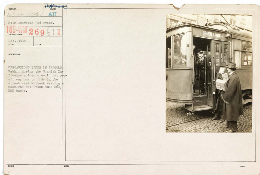
Figure 1: «Précautions prises à Seattle durant l'épidémie de grippe espagnole, ne permettant à personne de circuler dans la rue sans masque. La Croix Rouge fit 260 000 masques». Décembre 1918. National Archives of the United States, photographie N° 45499311/165-WW-269B-11.

l'imposition du masque sanitaire dans les lieux publics durant l'épisode de 1917-1918 aux États-Unis, ainsi que de la participation de la Croix Rouge à la production des masques. Ces photographies ont été largement exploitées depuis le début de la crise de la COVID-19. Deux documents de 1918 et 1919 sont pertinents, en raison de l'image, mais aussi et surtout des descriptifs qui les accompagnent : un premier cliché rapporte le cas de la ville de Seattle où le masque fut obligatoire dans les lieux publics et les transports, et pour laquelle la Croix Rouge fournit 260 000 masques (Figure 1) ; et un second, présente des membres de la Croix Rouge de Boston préparant des masques en tissu (Figure 2) 2 :