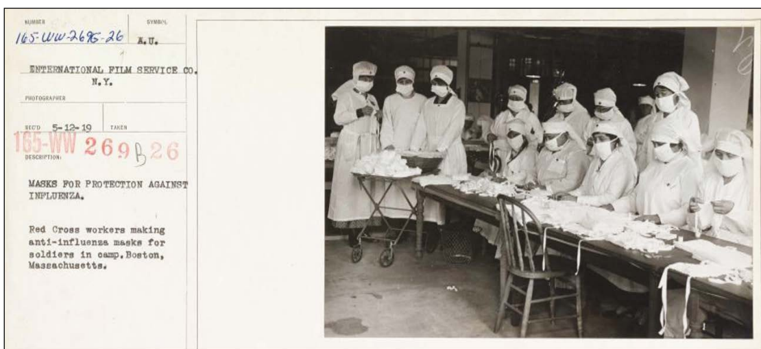
Figure 2: « Masques de protection contre l'influenza. Travailleuses de la Croix Rouge faisant des masques antigrippes pour des soldats des camps. Boston, Massachusetts ». National Archives of the United States, photographie N°45499341/165-WW-269B-26.

On conseille aussi de mettre un masque protecteur car il limite la diffusion des germes et si on ne dispose pas de masques, on peut aussi, écrit un médecin, dans Le Matin remplacer ce masque par « une simple compresse hydrophile trempée dans l'eau bouillie, posée sur le nez et la bouche et attachée par-dessus les oreilles avec un cordonnet ».