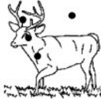
G. Pertinent Valide Non fiable