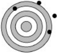
A. Non pertinent Non valide Non fiable