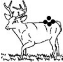
F. Pertinent Non valide Fiable