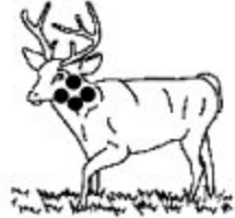
H. Pertinent Valide Fiable

Dans la situation A, le tir est non fiable parce que dispersé sur toute la surface de la cible fixe. Il est non valide, parce que la mesure manque de précision et ne peut attester l'atteinte de l'objectif. Il est enfin non pertinent puisqu'il ne correspond pas à l'objectif recherché et ne mesure donc pas, de toute façon, ce que je déclare vouloir mesurer.