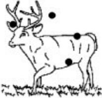
E. Pertinent Non valide Non fiable