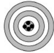
D. Non pertinent Valide Fiable