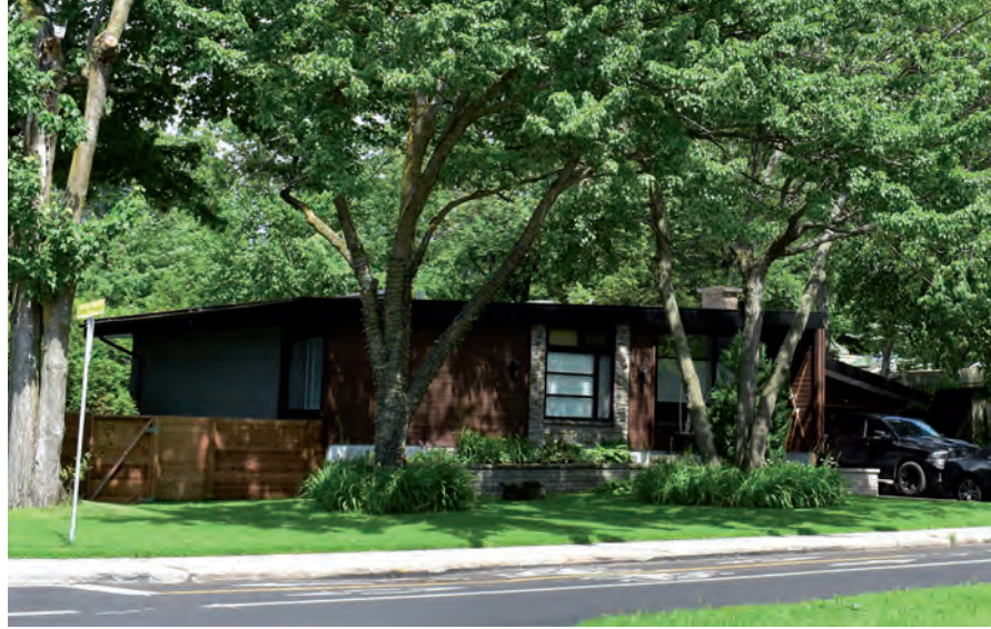
Maison californienne du quartier El Rancho de Duvernay, à Laval. Comment concilier la valorisation patrimoniale émergente et la nécessité d'adapter les résidences aux attentes et aux besoins actuels ?

Pendant que certains tentent de préserver les acquis dans les centres historiques et les quartiers anciens, d'autres poussent la patrimonialisation sur de nouveaux terrains. Depuis quelques années, c'est au tour de la banlieue de la première couronne de susciter l'intérêt. Westmount et Mont-Royal ont été reconnus comme lieux historiques nationaux. À Sillery, Sainte-Foy, Boucherville, Longueuil, Dorion, Trois-Rivières, ainsi que dans Mercier et le West Island montré-