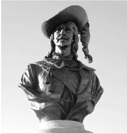
Monument de Pierre Dugua de Mons, par Hamilton MacCarthy, érigé en 2007, sur l'avenue Saint-Denis, près de la citadelle de Québec. ( https://fr.wikipedia.org/wiki/Pierre_Dugua_de_Mons ).

des êtres inférieurs, des « sauvages » que Champlain et ses contemporains (et par extension les Canadiens français) étaient venus « civiliser ». Ce récit a eu des conséquences néfastes considérables sur la connaissance de l'histoire du début du XVII e siècle. Pendant longtemps, on a ignoré les faits suivants. Une alliance franco-montagnaise scellée près de Tadoussac en 1603 a rendu possible la fondation de Québec en 1608. Le roi Henri IV a demandé et obtenu la permission d'envoyer des hommes en territoire montagnais. C'est Henri IV qui a élaboré la politique d'alliances de la France avec les « princes » autochtones et non pas Champlain. Il reconnaissait que les autochtones formaient des « peuples » et des « nations », comme Champlain dans ses récits. Champlain et les chefs alliés se disaient « frères ». Les environs de Québec n'étaient pas inhabités et il y avait une cohabitation. Les Montagnais-Innus nommaient Québec « Uepishtikueiau » (j'en connais qui le nomment encore ainsi). Le toponyme Québec serait issu d'un malentendu (de « kapak » en innu aimun, qui signifie « débarquez », et non « là où la rivière rétrécit » (« uepishitkueiau »)... J'ai étudié le déni de la contribution amérindienne à la fondation dans d'autres recherches. Pour des raisons pratiques, je n'y reviens pas ici. Il en va de même pour la contribution cruciale