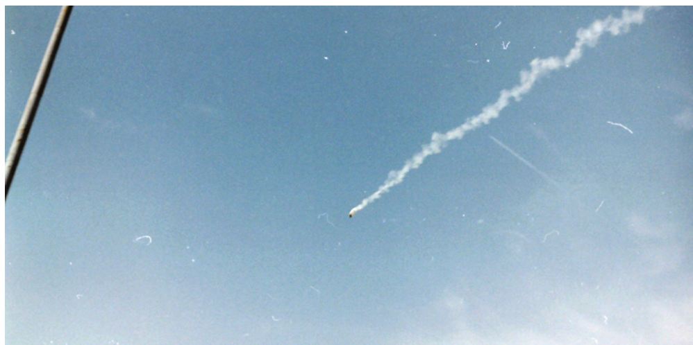
Manifestation à Québec le 21 avril 2001 lors de la 2 e journée du Sommet des Amériques.

Par la suite, certaines associations étudiantes, comme l'Association étudiante du