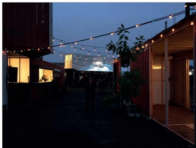
ILL. 32. LE VIRAGE LA NUIT AVEC UNE PROJECTION DE « MOMENT FACTORY », UN STUDIO MULTIMÉDIA SPÉCIALISÉ DANS LA CONCEPTION ET LA PRODUCTION D'ENVIRONNEMENTS IMMERSIFS. | JONATHAN CHA.

« mettent la participation citoyenne au cœur de la démarche en donnant la possibilité d'acquérir des outils pour devenir un acteur de changement et permettent d'aborder la question environnementale d'une façon éducative 79 ». Le lieu est abordable et adaptable. Comme l'écrit dans le Chicago Reader Maya Dukmasora 80 , qui considère les jardins communautaires comme transformateurs de la société urbaine, les villes doivent adopter une posture de spontanéité et offrir des espaces pour s'exprimer, expérimenter, tester, conceptualiser. L'évolution de ces nouvelles pratiques agiles et citoyennes 81 permet d'influencer la manière de façonner l'espace public et de répondre au « désir de ville ». L'adaptation, l'agilité, la flexibilité et l'informalité constituent des ingrédients importants des formes émergentes d'espaces publics.