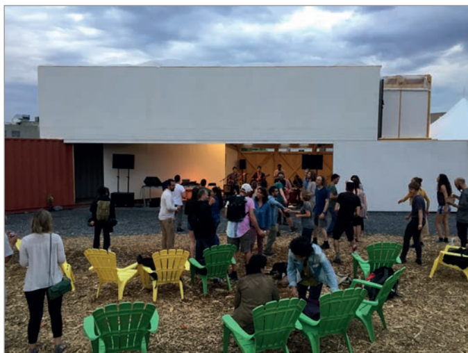
ILL. 25. PRESTATION MUSICALE DANS LE GRAND HALL ET SUR L'ESPLANADE DU VIRAGE. | JONATHAN CHA.