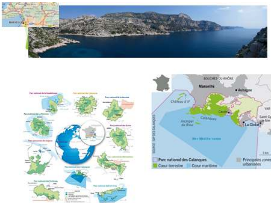
Figure 3. Le Parc national des Calanques Périurbain de Marseille.