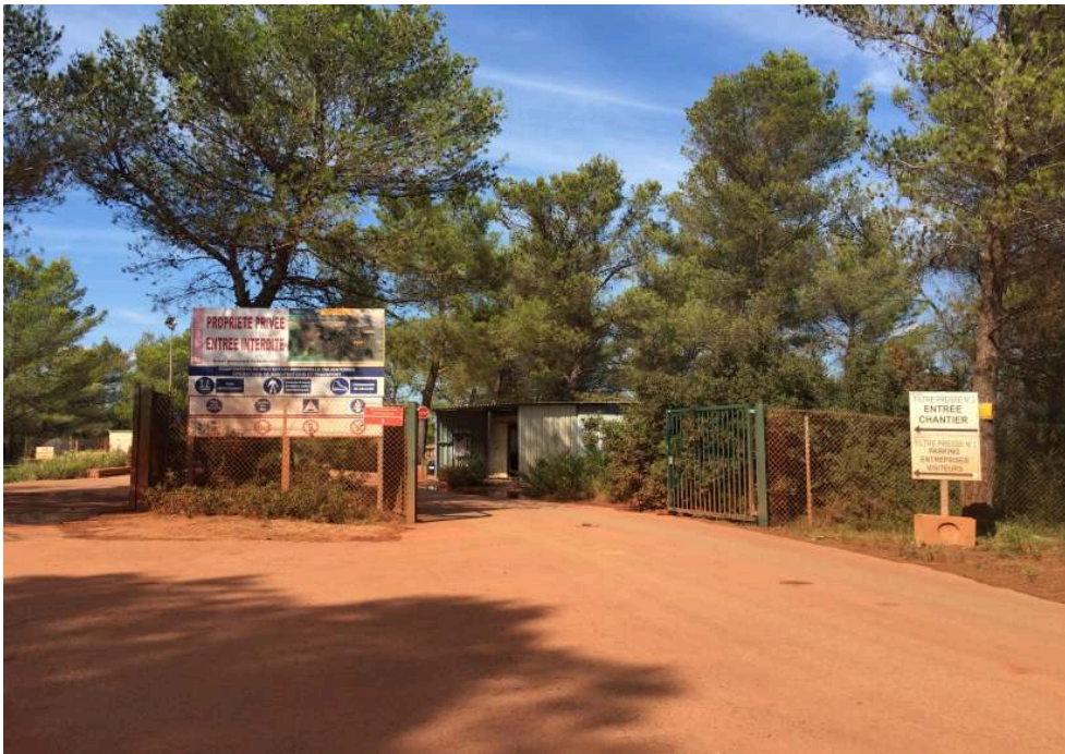
Figure 2. Entrée du dépôt de Mange-Garri à Bouc-Bel-Air, septembre 2016.