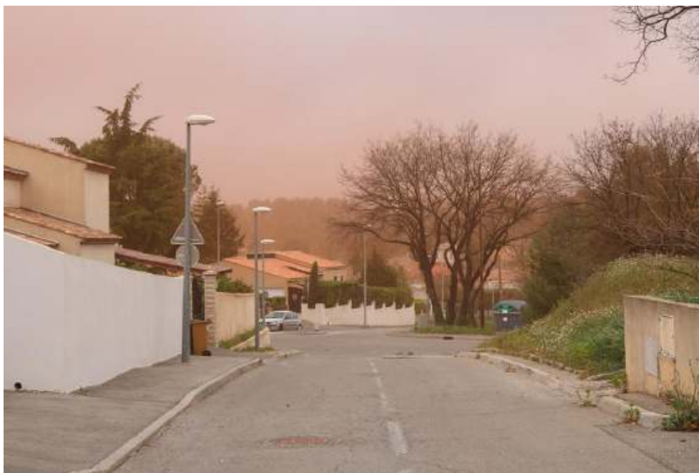
Figure 6. Lotissement proche du site de Mange-Garri, envolement de poussières rouges par grand vent, mars 2018.