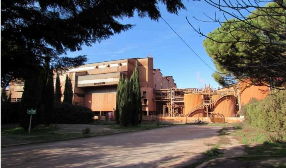
Figure 1. L'usine Altéo Gardanne, octobre 2015.