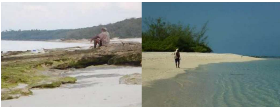
Figure 2. Hommes kanak scrutant l'océan depuis Cöu (photographie de gauche), depuis Gööny (photographie de droite) / Kanak man watching the ocean.