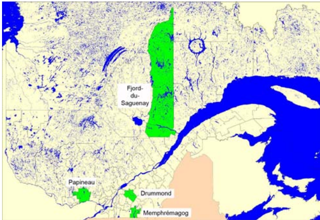
Figure 1. Localisation des MRC à l'étude

classification du ministère des Affaires municipales et des Régions (MAMR), deux de ces MRC étaient considérées comme à « fort développement » (Drummond et Memphrémagog) tandis que les deux autres comme présentant un fort potentiel mais un « faible développement » (Fjord-du-Saguenay et Papineau).