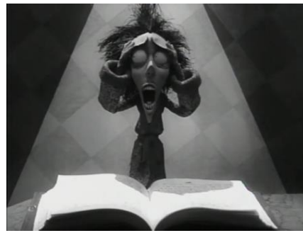
Vincent (Tim Burton, 1982)