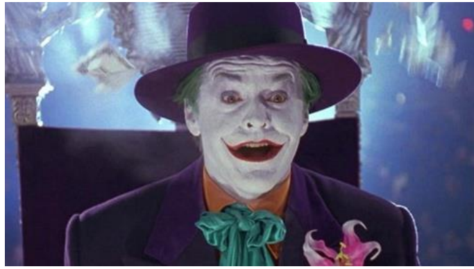
Batman (Tim Burton, 1989)

Ce contact tactile du Joker avec les œuvres exposées nous permet de donner une première interprétation à la place importante accordée à de nombreuses toiles peintes dans le cinéma burtonien. Si la référence à certaines d'entre elles permet de retranscrire une atmosphère particulière, émotion ou force symbolique qui leur sont inhérentes, la volonté de matérialisation en trois dimensions de sujets picturaux est prépondérante. Lors du tournage, les peintures prennent vie à travers des acteurs et actrices, des costumes réels et des décors palpables. Les œuvres picturales deviennent tangibles. L'interdit muséal se trouve bafoué : les peintures sont emparées à pleines mains par ces films.