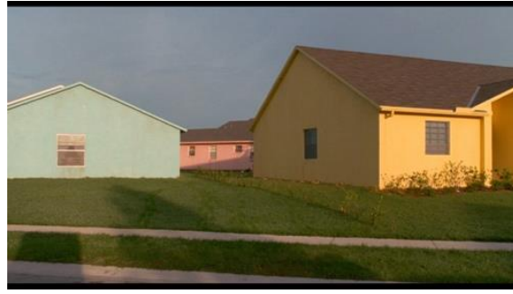
Edward Scissorhands (Tim Burton, 1990)

Dans Big Eyes , la majestueuse villa des Keane aux grandes baies vitrées, théâtre de jeux de réflexion et de lumière avec la piscine, rappelle les nombreuses peintures de piscine d'Hockney, particulièrement A Bigger Splash (1967). Jérôme Lauté compare l'esthétique de l'immense demeure de Big Eyes , à l'apparence inhabitée, avec l'œuvre de Richard Estes qui vide la société américaine de toute présence humaine et qui, par un travail sur les surfaces réfléchissantes, souligne la déshumanisation produite par la société occidentale : l'eau de la piscine des Keane refléchi sur les fenêtres de la villa est, en ce sens, une incarnation de la vanité 10 . Big Eyes , à lui seul, peut être considéré comme une citation de quasi deux heures, d'abord à travers les citations directes des peintures de l'artiste Margaret Keane (Amy Adams), mais également par le biais d'une tentative esthétique de se rapprocher de l'hyperréalisme des toiles de Richard Estes 11 — grâce à un travail sur les couleurs et la lumière.