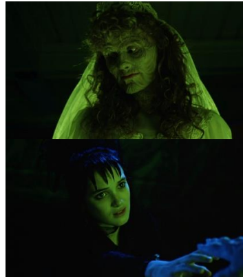
Beetlejuice (Tim Burton, 1988)

Cette expression de la vanité, et particulièrement celle de la vacuité des activités humaines, se marque fortement chez Burton par des décors vidés de toute présence, qui rappellent la prédominance du sentiment de solitude chez Edward Hopper ou David Hockney. La maison de Beetlejuice renvoie à la fois à celle de Psycho (Alfred Hitchcock, 1960), mais également à celle de House by the Railroad (Edward Hopper, 1925), maison typique de la Nouvelle-Angleterre. Plus généralement, qu'il s'agisse des manoirs gothiques d' Edward Scissorhands ou de Miss Peregrine's Home for Peculiar Children (2016), de la maison anciennement mitoyenne du père de Willy Wonka (Christopher Lee) dans Charlie and the Chocolate Factory (2005), devenue le dernier vestige d'une rue désormais déserte, ou encore de la ville abandonnée de Spectre dans Big Fish (2003), les lieux donnant l'impression d'être inoccupés abondent dans le cinéma burtonien. Dans Edward Scissorhands , la noirceur intérieure des individus est camouflée derrière des