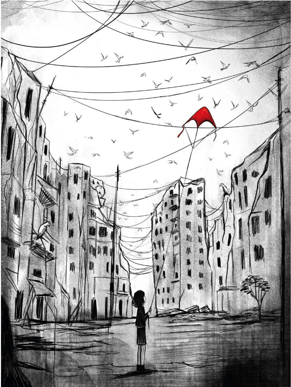
Les oiseaux ne se retournent pas, Nadia Nakhlé (2020, planche 3)