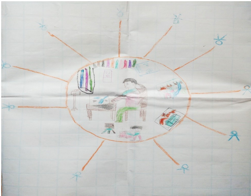
Figure 2 Logo du groupe de recherche créé par les co-chercheur.e.s

Quelques-unes des entrées du carnet relatent les activités de recherche au cours desquelles la chercheuse et les co-chercheur.e.s ont travaillé à l'établissement de leur groupe de recherche et à la création de son logo ou de son identité visuelle. Lorsque les co-chercheur.e.s ont décidé de créer un logo en tant que groupe (voir Figure 2), ils.elles ont placé la chercheuse comme une figure proéminente (dans le cercle central avec les différents outils de collecte de données). À cet égard, l'adulte représentait l'étude de recherche et les activités dans lesquelles les co-chercheur.e.s étaient engagé.e.s. Alors que les co-chercheur.e.s décrivaient la chercheuse comme un point d'ancrage qui maintenait le groupe de recherche ensemble et organisait les activités de recherche, c'était aussi un aperçu du déséquilibre de pouvoir qui est toujours présent dans la relation et les interactions entre un.e chercheur.e adulte et de jeunes co-chercheur.e.s. Par conséquent, la réflexivité est devenue nécessaire pour surveiller en permanence les déséquilibres de pouvoir qui pouvaient se manifester sous des formes subtiles au cours du processus de recherche.