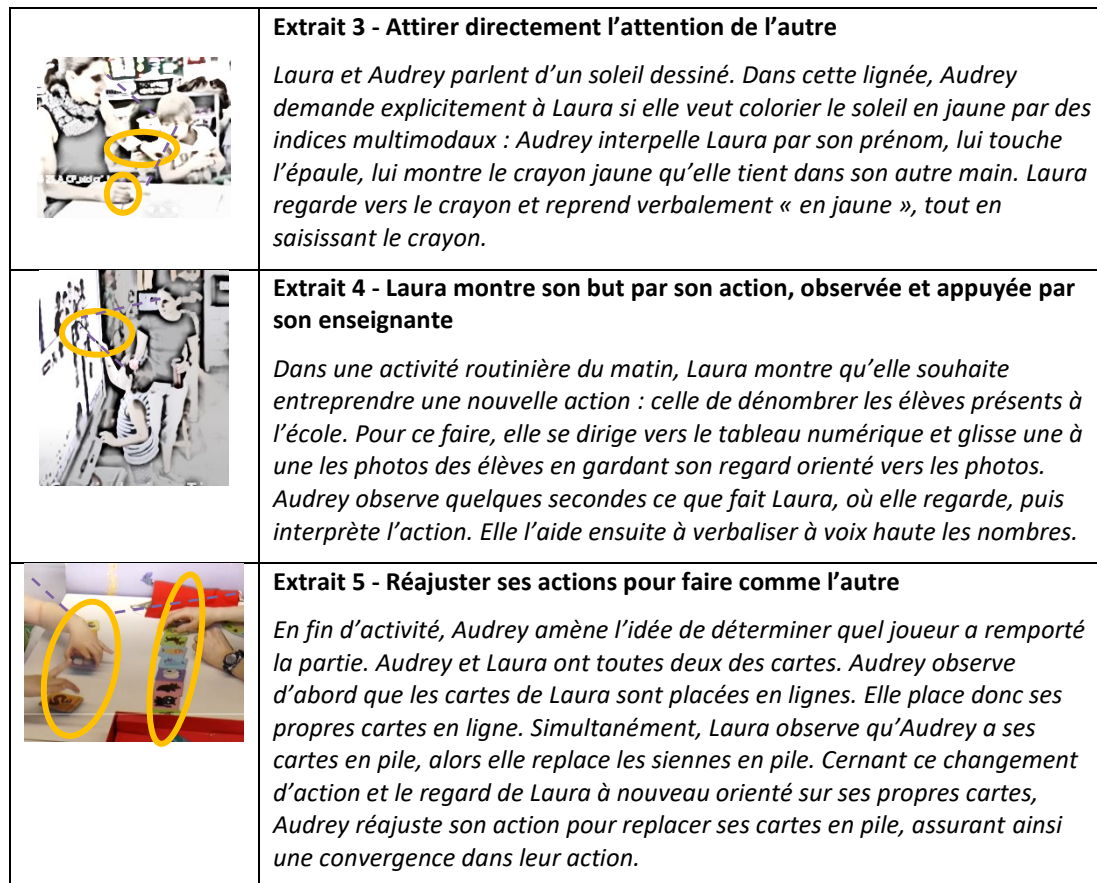
Figure 3. Différentes manières d'attirer l'attention de l'autre pour obtenir son attention conjointe et orienter conjointement leurs buts/coordonner l'action.

figure 3 illustre trois manières pour Audrey et Laura de combiner différents indices pour ajuster leur attention conjointe lors de différentes activités à table, que ce soit en tête à tête ou dans une activité de groupe. Plus spécifiquement, l'extrait 5 montre comment il est parfois nécessaire de réajuster les actions pour garantir que l'attention conjointe des deux participantes soit alignée sur les mêmes buts, permettant ainsi d'entreprendre une action partagée.