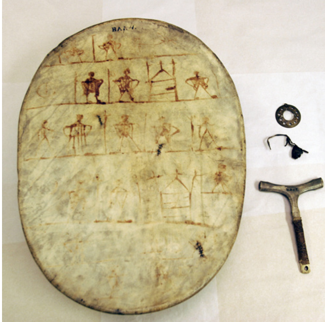
Figure 1 Le tambour, le marteau et la bague de cuivre de Paul-Ånde (Anders Poulsen)