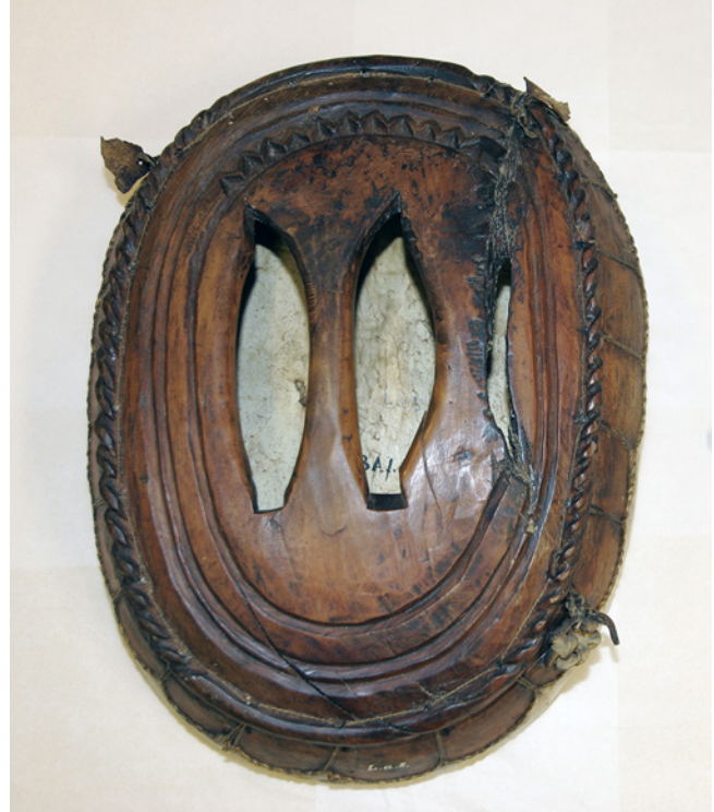
Figure 2 L'arrière du tambour

Les tambours sámi et d'autres objets sacrés avaient été saisis, brûlés ou vendus comme curiosités exotiques lors des missions et de la colonisation du Nord aux XVII e et XVIII e siècles. De nos jours, environ soixante-dix tambours sámi ont été conservés, et il reste en outre quelques images