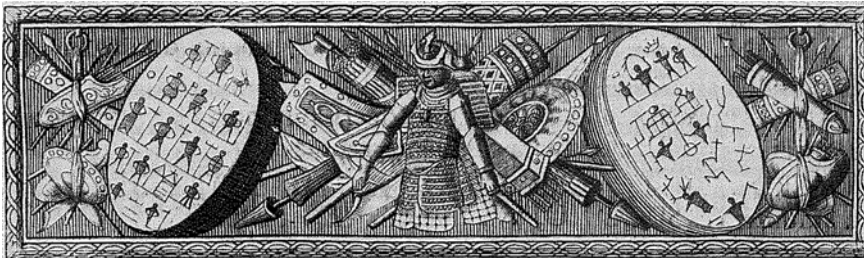
Figure 5 Les figures du tambour entrelacées dans la vignette d'ouverture ne sont pas aléatoires, mais sont principalement dessinées en fonction des objets spécifiques qui se trouvaient dans la collection

religion des Sámi ont été exposés dans des musées sámi, mais uniquement en tant que prêts de musées européens.