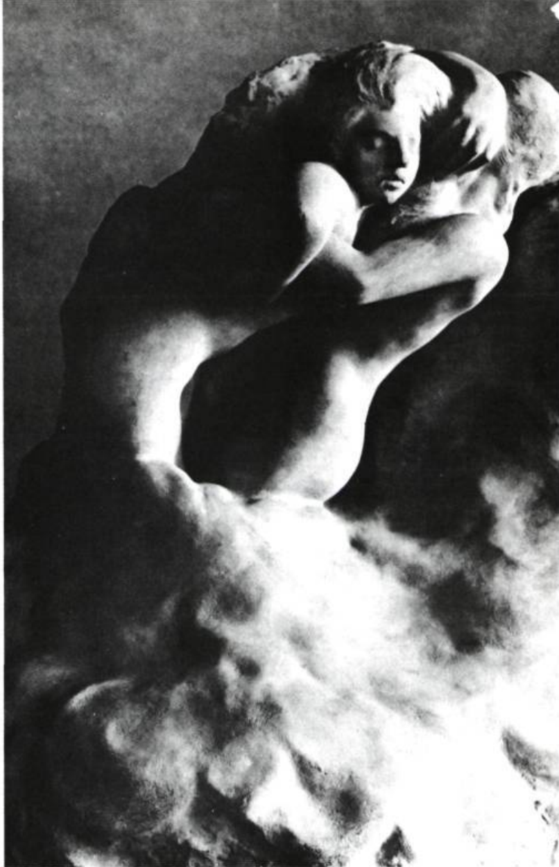
Auguste Rodin (1840-1917): Paolo et Francesca. Marbre