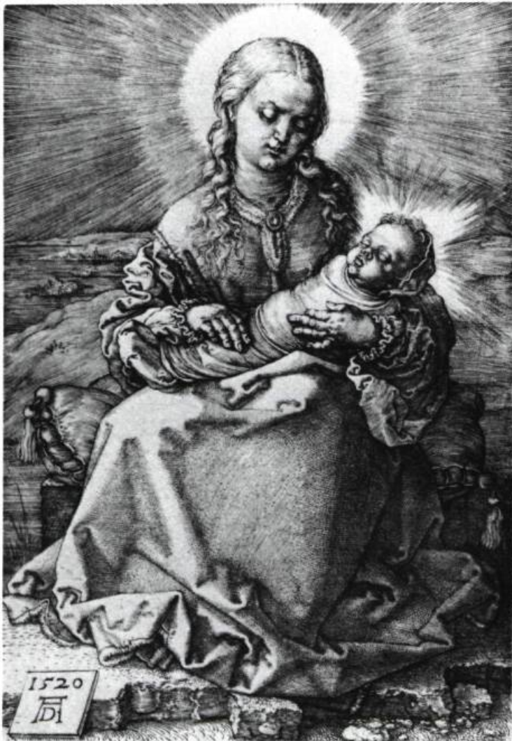
Albrecht Dürer: Vierge à l'enfant, 1520

de protection contre l'esclavage dans l'amour. Il faut respecter dans l'amour le soi de l'autre, et non pas le réduire, en faire une victime.