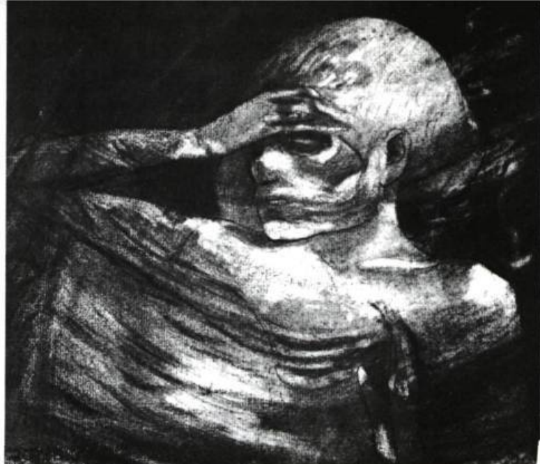
Paul Gauguin: Madame la Mort , 1891

Dans l'amour, il y a un moment d'identification avec l'être aimé où on est complètement l'autre. C'est un état d'osmose et de complicité qui manque beaucoup. Alors si on n'a pas cette plasticité — car il faut être très souple pour épouser l'autre à ce point — je trouve que l'on reste figé et que l'on est, d'une part, très solitaire, puis incapable de créer, on est ossifié, on est toujours le même, on se