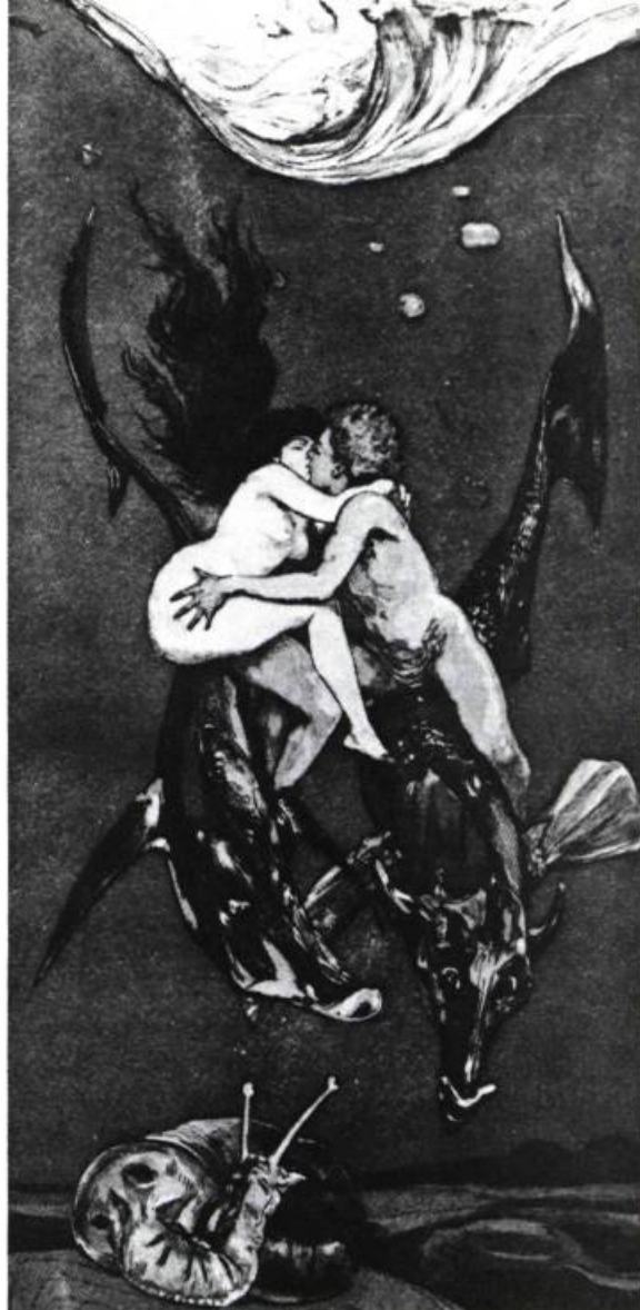
Max Klinger: Séduction , 1883

C'est ce qui apparaît peut-être dans l'aspiration actuelle à l'amour: soyez femme aussi comme cela, donnez-nous des relations tendres, stables. Il y a une espèce d'appel à la part amoureuse et féminine (si l'on veut) de l'homme, qui va contre le machisme classique. Je crois qu'il y a un retour de manivelle de la part des hommes, en réaction très violente à certains excès du féminisme antérieur. La jeune génération des filles autour de 25 ans y réagit également; ça s'est vu à travers des mouvements de séduction plutôt que de militantisme. Elles se moquent de leurs mères militantes, elles veulent être séduisantes. Ça peut être considéré comme l'aspect léger et réactionnel ou réactionnaire, mais c'est aussi un phénomène sociologique plus profond, qui consiste à essayer de repren-