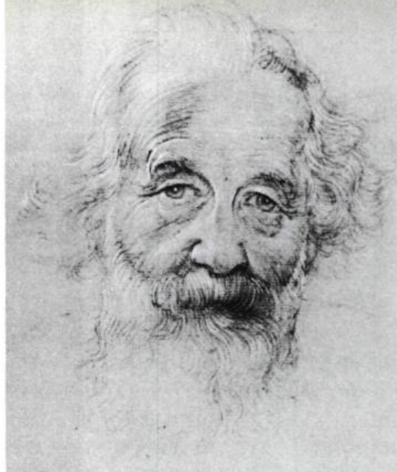
Bachelard par Hans Bellmer, 1957