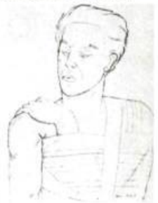
André Breton par Max Ernst, 1924

«C'est de rationalisme, de rationalisme fermé qu'est en train de mourir le monde», affirmait Breton dans ses Entretiens , et c'est contre ce même rationalisme que Bachelard en a, bien que par ailleurs, leur critique respective n'implique ni chez l'un, ni chez l'autre, une condamnation absolue de la raison, pas plus qu'un appel à l'irrationalisme. Ils lui opposent tous deux un «rationalisme ouvert», où seraient rétablis les droits et la valeur de l'imagination. Il supposerait une reconsidération de notre idée même de raison, suggérerait en quelque sorte un retour à une raison véritable , plus saine . L'écho de Nietzsche se devine.