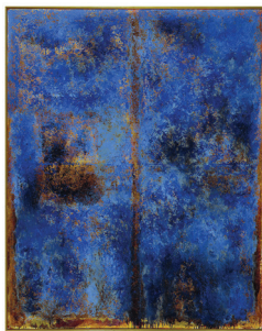
L'identité constitutionnelle autochtone