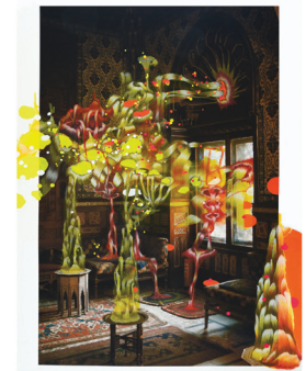
Français Reprendre l'initiative

Dix numéros par année des analyses sérieuses, des dossiers inédits, un regard assumé sur les essais, un point de vue québécois sur le monde