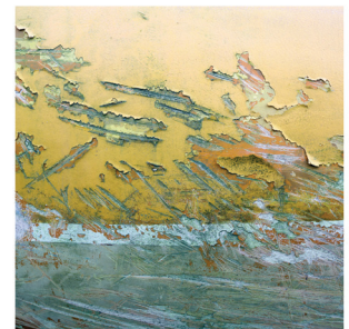
Immigration Qui contrôle quoi?