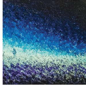
Gazoduc Saguenay, le gaz et le non-sens