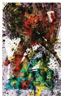
Brexit et Catalogne Les voies inconnues