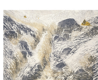
Les régions du Québec ont un rendez-vous avec elles-mêmes