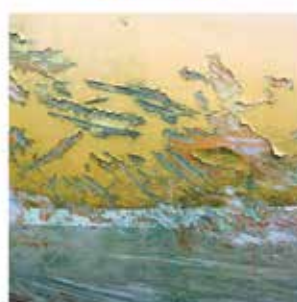
Immigration Qui contrôle quoi?