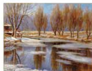
Maurice Séguin : le sens de l'héritage