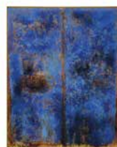
L'identité constitutionnelle autochtone