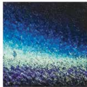
Gazoduc Saguenay, le gaz et le non-sens