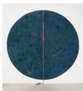
Élections 2018 Horizon et perspectives