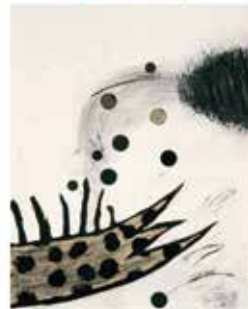
Brexit Entre l'arbre et l'écosse Canada français Pour une repolitisation