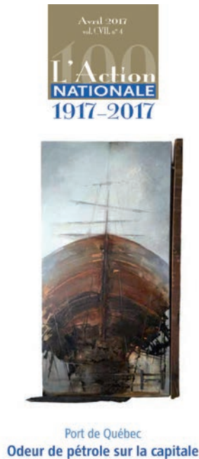
Port de Québec Odeur de pétrole sur la capitale