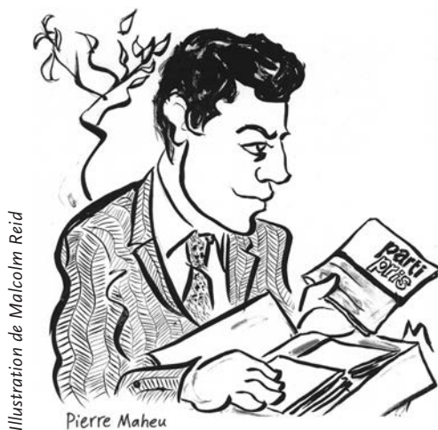
Illustration de Malcolm Reid Pierre Maheu

Paris, les années trente. Le romancier Paul Nizan évoque dans son roman La Conspiration un trio de jeunes qui lance une revue de gauche, très à gauche, qu'ils appellent La Guerre civile . «Ils ne se doutaient pas alors que ce qu'il y avait de plus important dans cette aventure c'était les heures qu'ils passaient avec des typographes habiles et narquois, dans la petite imprimerie.»