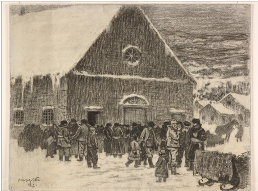
ILL. 1. MARC-AURÈLE DE FOY SUZOR CÔTÉ, ITE MISSA EST , ILLUSTRATION POUR MARIA CHAPDELAINE DE LOUIS HÉMON, 1916. | COLLECTION MNBAQ.

Il m'apparaît important d'explorer ces questions aujourd'hui puisque, dans un contexte de laïcité de plus en plus affirmée, la relation historique entre une église et sa communauté tend à être vue de manière très simplifiée, voire simpliste, ce qui est partiellement dû au fait que les historiens de l'architecture eux-mêmes – architectes ou historiens d'art de formation – se sont peu penchés sur la question. En effet, les approches privilégiées traditionnellement en histoire de