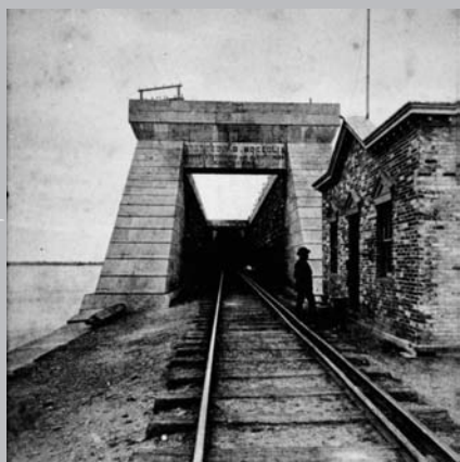
Premier pont Victoria.

« (...) concevoir, fabriquer et apporter sur place des caissons étanches grâce auxquels il deviendra possible, après les avoir vidés de travailler en cale sèche pour creuser le lit du fleuve jusqu'au roc et y déposer la pierre des piliers; faire fabriquer les pièces du tube où circulera le train [...] et les apporter sur le site; dessiner et construire un pont roulant en vue de l'assemblage du tube. » 1