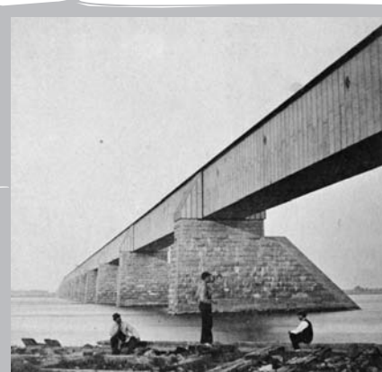
Premier pont Victoria.

Il appert que 3 040 personnes travaillèrent à la construction du pont et qu'on y utilisa 144 chevaux, 6 bateaux vapeur et 72 barges. La tâche fut monumentale. Il a fallu :