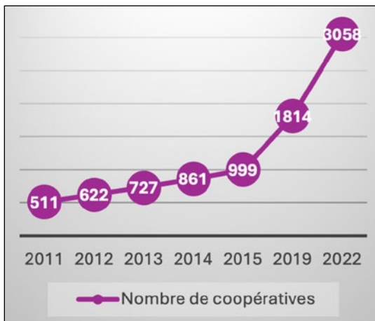
Figure 1. Évolution du nombre de coopératives dans la région DT depuis 2011