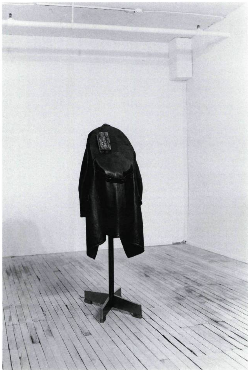
Guy Bourassa, Portraits de Bleu, Blanc, Noir et Brun. Et avant le début il y a Brun , 1993. Patère (bois recouvert d'aluminium), manteau de cuir et écorce d'arbre; 153 x 35 x 31 cm.