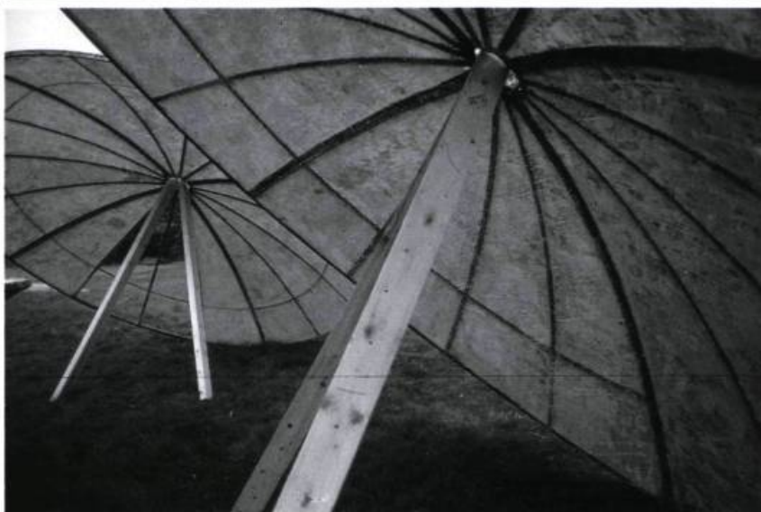
Parabole, Les Saintes, 1993. Antennes paraboliques/Parabolic antennae, cire/wax. Diam. : 3,04 m. Mont Orford. Ici, l'antenne parabolique se prête à la notion d'aura, d'auréole et de lieu sacré/Here, the parabolic antenna lends itself to the notion of aura, halo and sacred place.