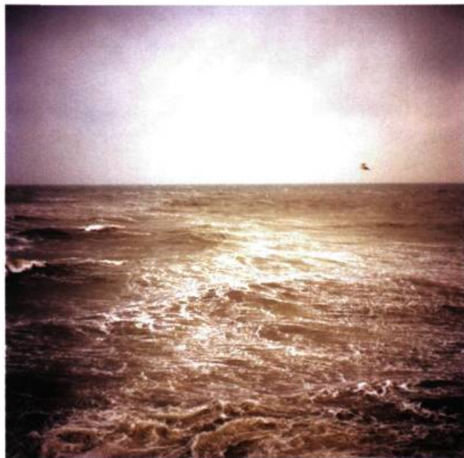
N44°10'19.7" – EO 28°39'55.9"