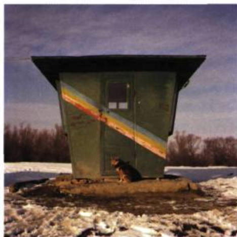
N 45°28'12.0" – EO 28°11'13.4"