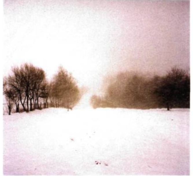
N 47°56'50.1" – EO 25°37'14.5"