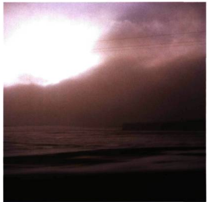
N 55°03'34.8" – EO 22°35'33.3"