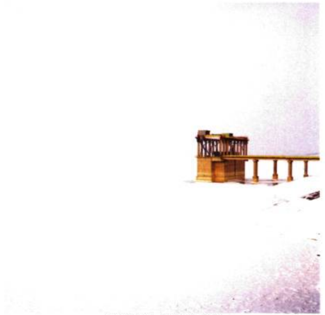
N 47°50'14" – EO 27°13'19.3"