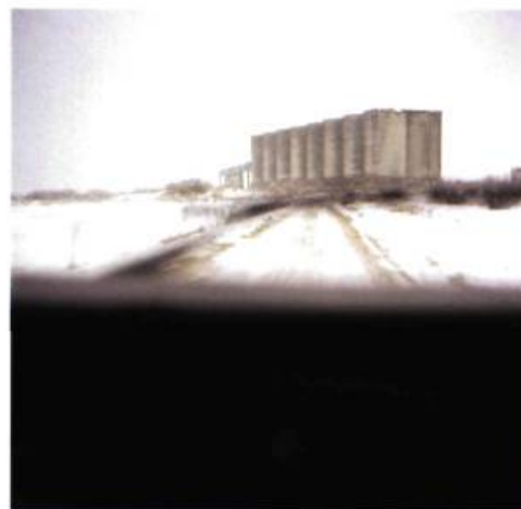
N 55°07'58.9" – EO 21°43'48.9"