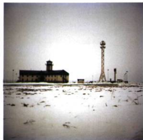
N 54°19'02.6" – EO 25°30'14.3"