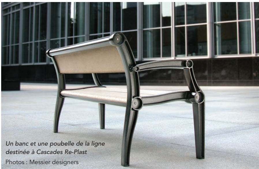
Un banc et une poubelle de la ligne destinée à Cascades Re-Plast