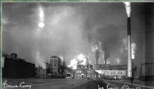
La Brown en 1951